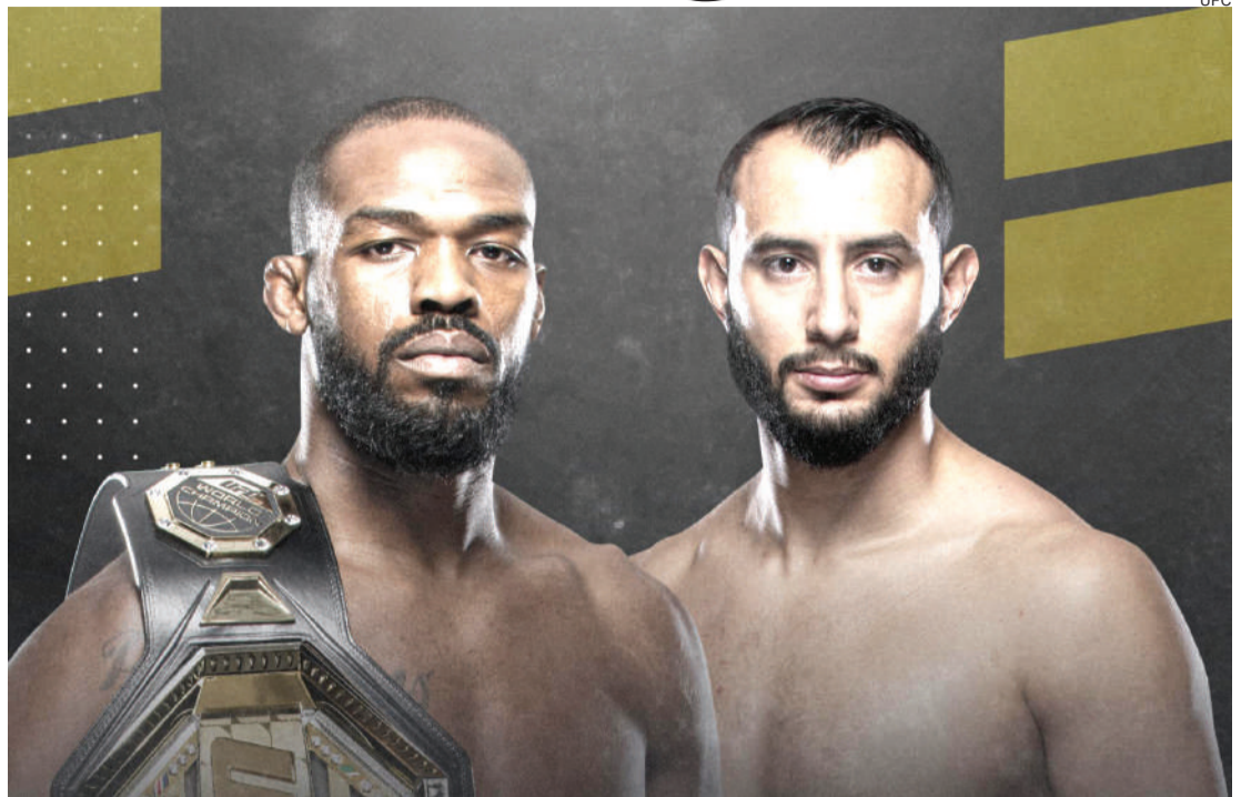
Jon Jones e Dominick Reyes farão duelo de invictos em fevereiro

“Essa é uma luta enorme para Jon Jones. Dominick Reyes é um garoto malvado. Jovem, faminto, essa vai ser uma luta muito interessante para Jon Jones. Dominick Reyes não é um grande nome que você conheça, mas se você entende de luta,