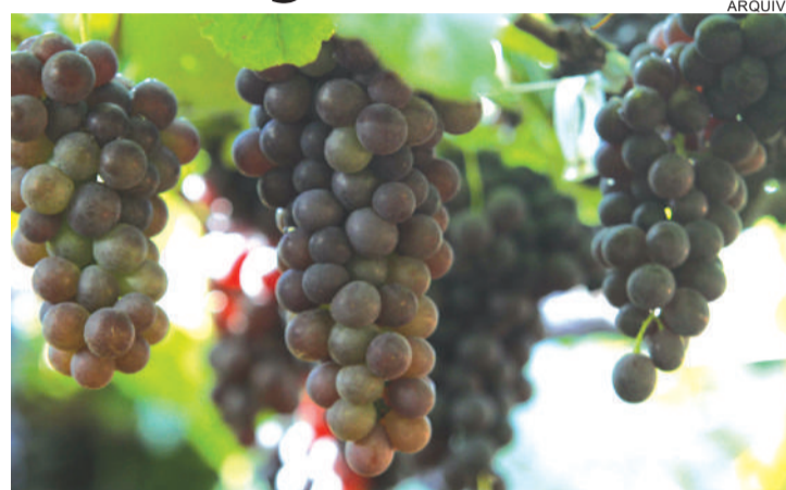
Clima colaborou para a produção da uva na região

Os custos da produção não são altos, pois o trabalho é todo realizado pela família. “Nesse ramo o mais caro é você montar um parreiral. Já o manejo todo é feito pela família, então não temos custos de funcionários, por isso compensa. A atividade de cultivo de uvas já está na minha família há mais de 60 anos, começou com meu avô, que vendia também na beira da estrada. Depois paramos e há 15 anos voltamos com a