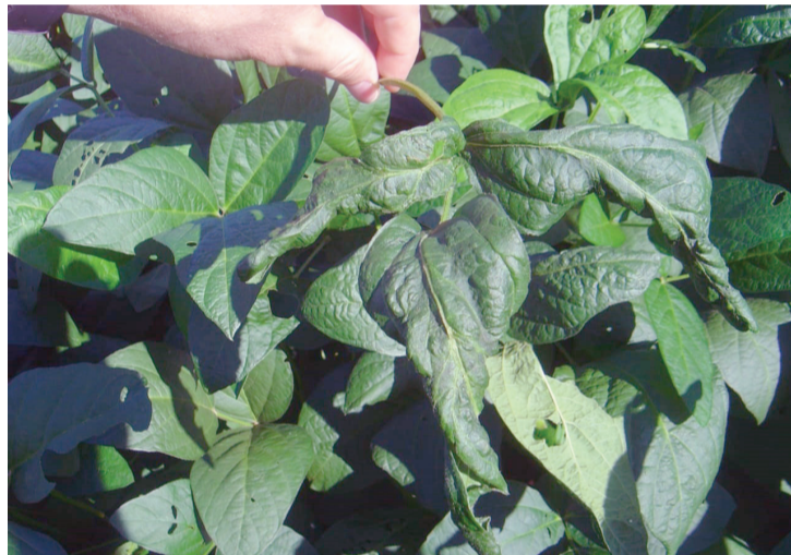
A doença pode dizimar lavouras inteiras de soja