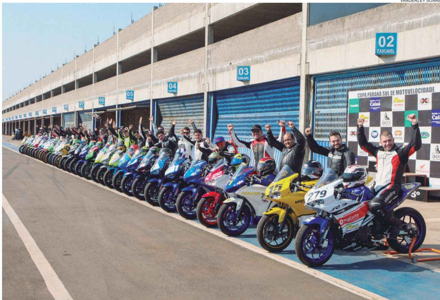
O Autódromo Zilmar Beux terá também provas longas de motociclismo neste ano