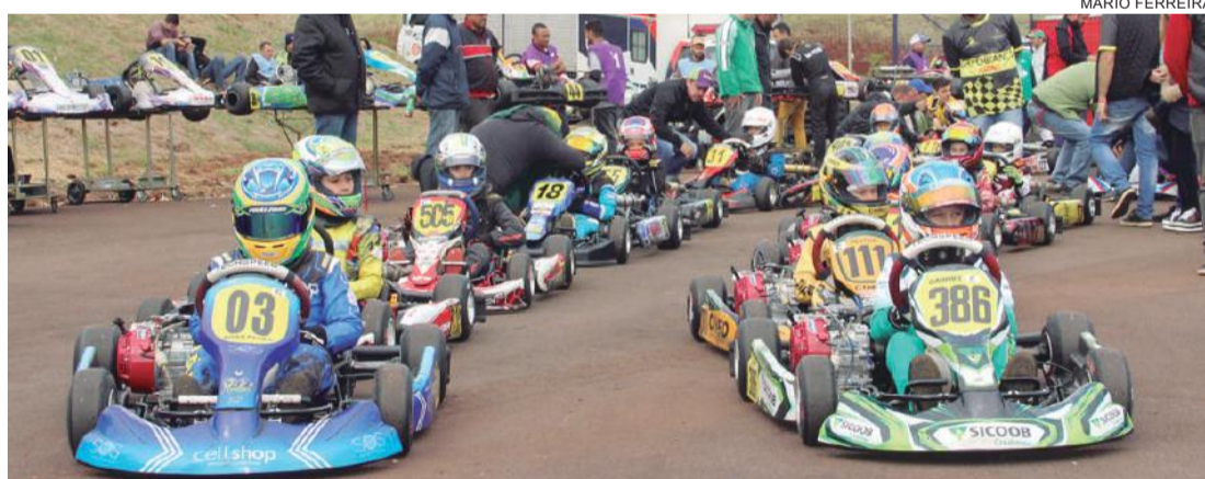
Regional com provas em Cascavel, Foz e Campo Mourão, deverá reunir mais de 100 pilotos