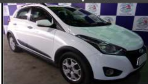
HYUNDAI HB 20 16A 14/15 LANÇE A PARTIR DE R$ 16.800,00

UTILITÁRIOS: 1 F250 XL 00/00 1 STRADA WORKING 14/15 1 NOVA SAVEIRO CS 13/14 1 MONTANA CONQ 08/09