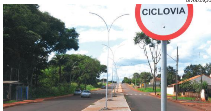
Ciclovia recebeu 67 postes que receberão 130 luminárias

Na extensa ciclovia, feita toda em pavers e com total acessibilidade para portadores de deficiência e idosos, foram colocados 67 postes que receberão 130 luminárias. Para obter mais eficiência e economia de energia, o governo municipal projetou a implantação de lâmpadas LED (Diodo Emissor de