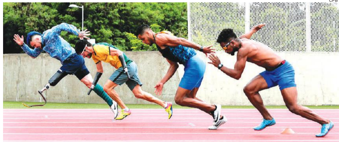
Melhores paratletas do atletismo brasileiro treinam no CT Paralímpico

Rio de Janeiro – Em ano de Paralimpíada, o Centre de Treinamento Paraolímpico, em São Paulo, receberá mais de 200 eventos de 17 modalidades em 2020.