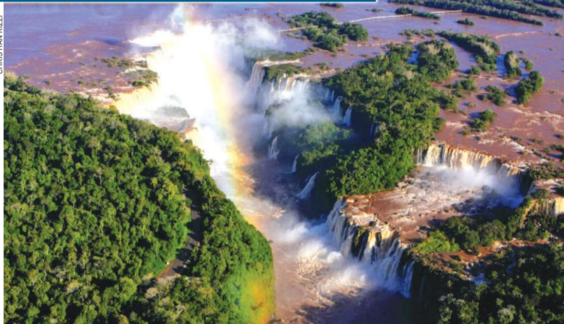
Parque recebeu ano passado 2 milhões de visitantes do mundo todo

A usina vai realizar a entrega da revitalização do Gramadão, já prepara a reforma do Mirante Central e do Vertedouro, além dos grandes projetos, que possuem investimentos da Itaipu, como a ampliação da pista do Aeroporto de Foz do Iguaçu e também dos acessos ao terminal, e a Segunda Ponte, entre Brasil e Paraguai.