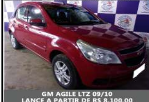
GM AGILE LTZ 09/10 LANÇE A PARTIR DE R$ 8.100,00

Condições de venda, relação completa dos veículos e fotos, acesse: