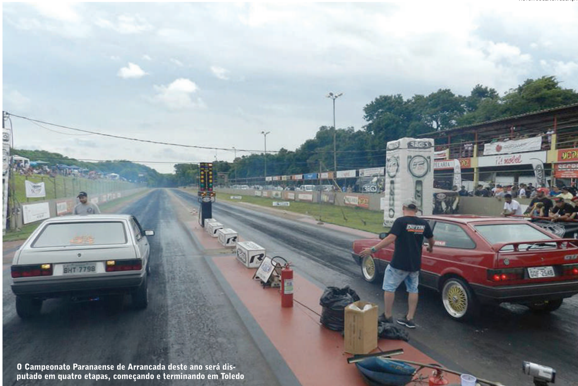
O Campeonato Paranaense de Arrancada deste ano será disputado em quatro etapas, começando e terminando em Toledo

Toledo abre no próximo fim de semana a temporada de arrancada. Sábado e domingo a pista do Autódromo Rafael Sperafico será palco da primeira etapa do Campeonato Paranaense de Arrancada de 201 Metros. A prova terá promoção e organização do Automóvel Clube de Toledo e da Associação dos Pilotos de Arrancada de Toledo, com supervisão da FPrA