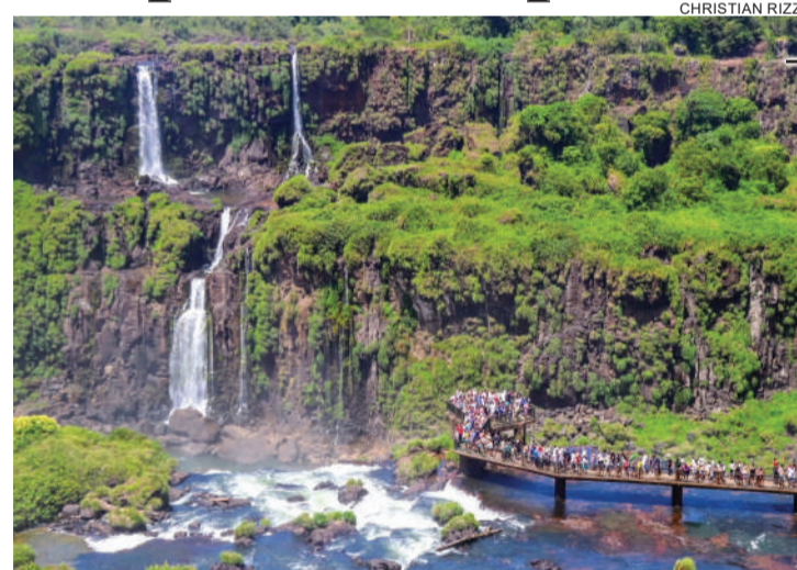
As Cataratas do Iguaçu são a principal atração na fronteira

Além de sol e praia, a busca de outras variedades do turismo tem crescido desde 2014. A visita ao Brasil pelo ecoturismo, por