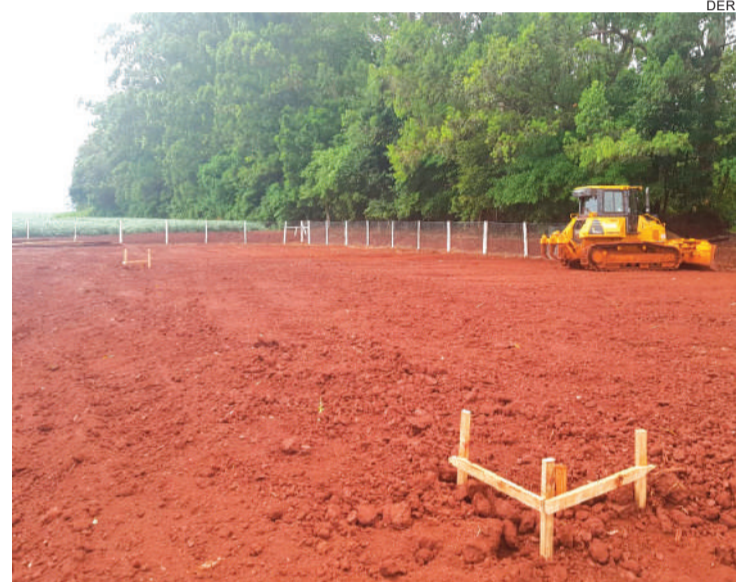
Os serviços serão na altura da Avenida das Orquídeas

A obra inclui serviços de terraplenagem, pavimentação, sistemas de drenagem e obras de arte correntes, obra de arte especial, sinalização e serviços complementares.