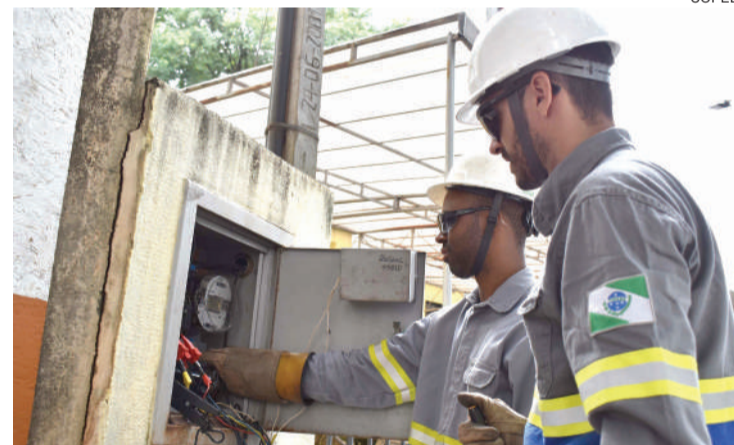
A maior parte dos “gatos” é feita dentro da entrada de serviço das unidades consumidoras

regulamente. Isso porque, sem o trabalho de fiscalização por parte da empresa, parte dos valores vai para a conta de luz daqueles que pagam em dia. Ele chama a atenção também para a questão de segurança. “As ligações irregulares trazem risco de choque elétrico para quem as executa, e ainda podem causar sobrecarga na rede, provocando variação de tensão, e até incêndios”, afirma.