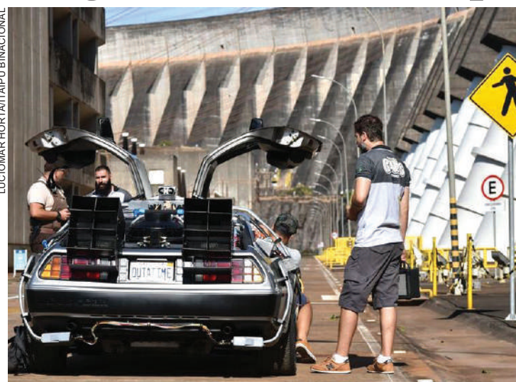
Carro futurístico será uma das atrações em novo entretenimento na fronteira

A passagem do DeLorean pela maior geradora de energia do planeta não é por acaso. No filme, o cientista Emmett Brown (Christopher Lloyd) descobre um jeito de fazer o carro viajar no tempo canalizando 1,21 GW (gigawatts) de energia para