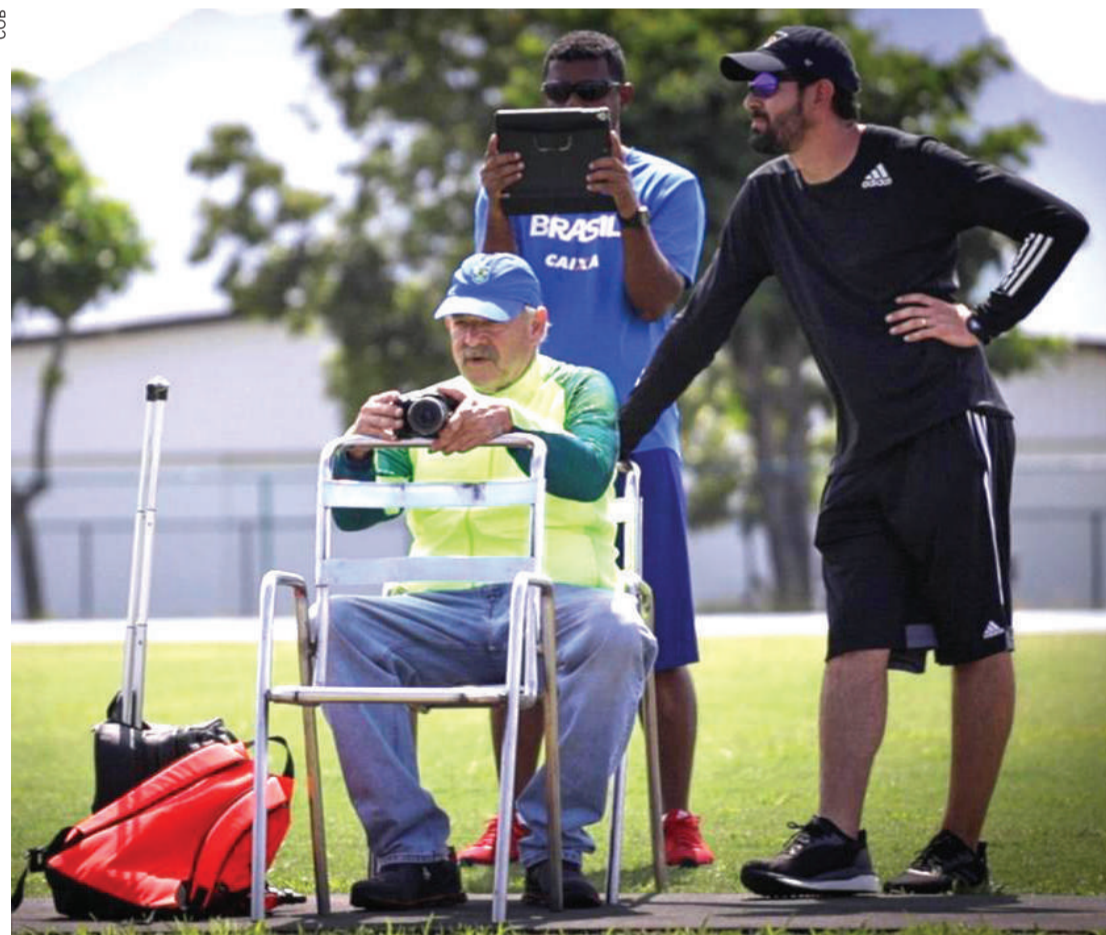
Consultor estadunidense filmou treinos e coletou dados dos atletas brasileiros