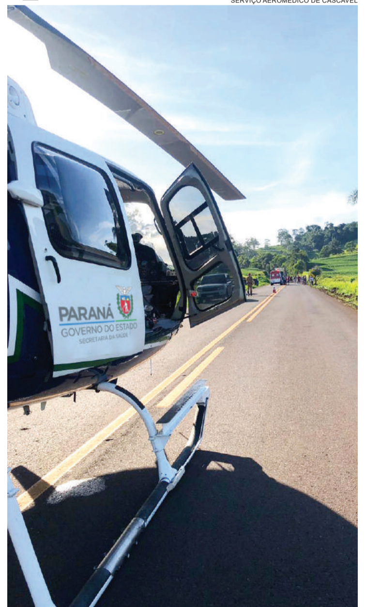
O serviço já atendeu mais de 2.400 acionamentos, sendo 2.327 missões realizadas com paciente