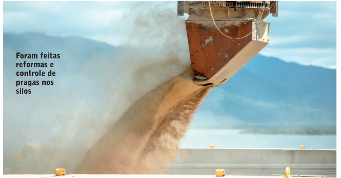
Foram feitas reformas e controle de pragas nos silos