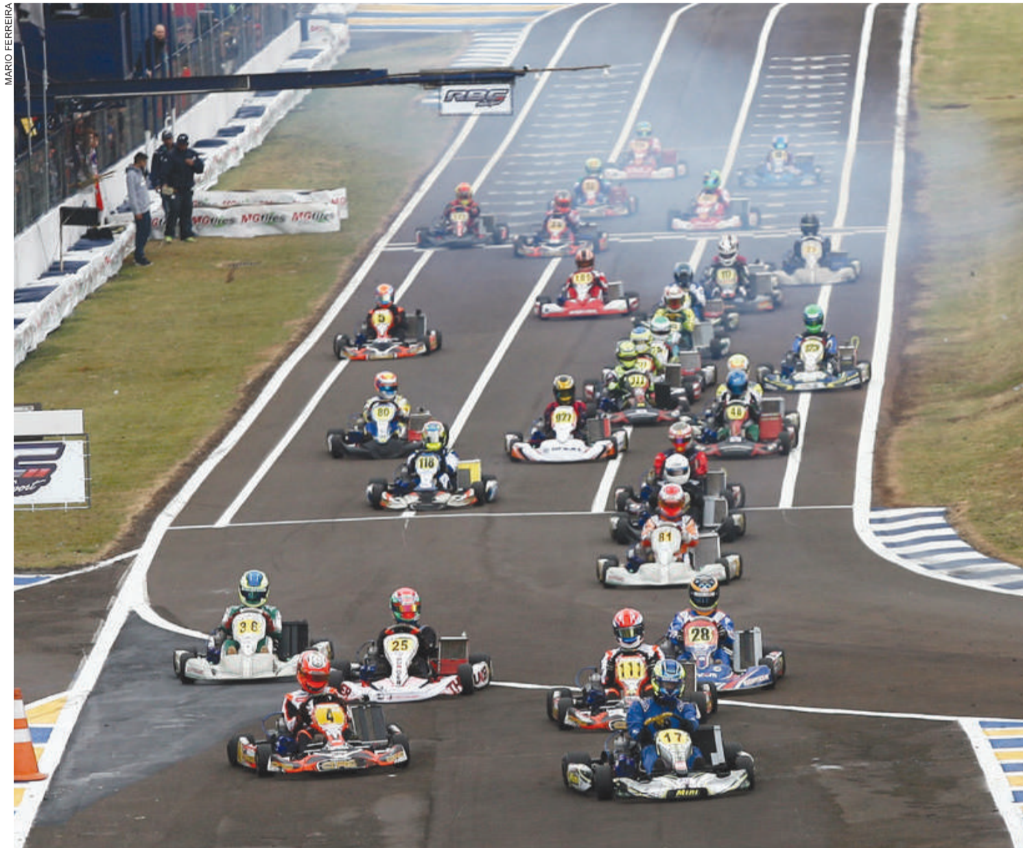
O Campeonato Brasileiro de Kart do ano passado foi disputado no Kartódromo Delci Damian, em Cascavel

A CBA (Confederação Brasileira de Automobilismo), por meio da CNK (Comissão Nacional de Kart), divulgou o regulamento do 55º Campeonato Brasileiro de Kart. A competição será disputada de 6 a 18 de julho, no Kartódromo Speed Park, em Birigui, na região oeste de São Paulo.