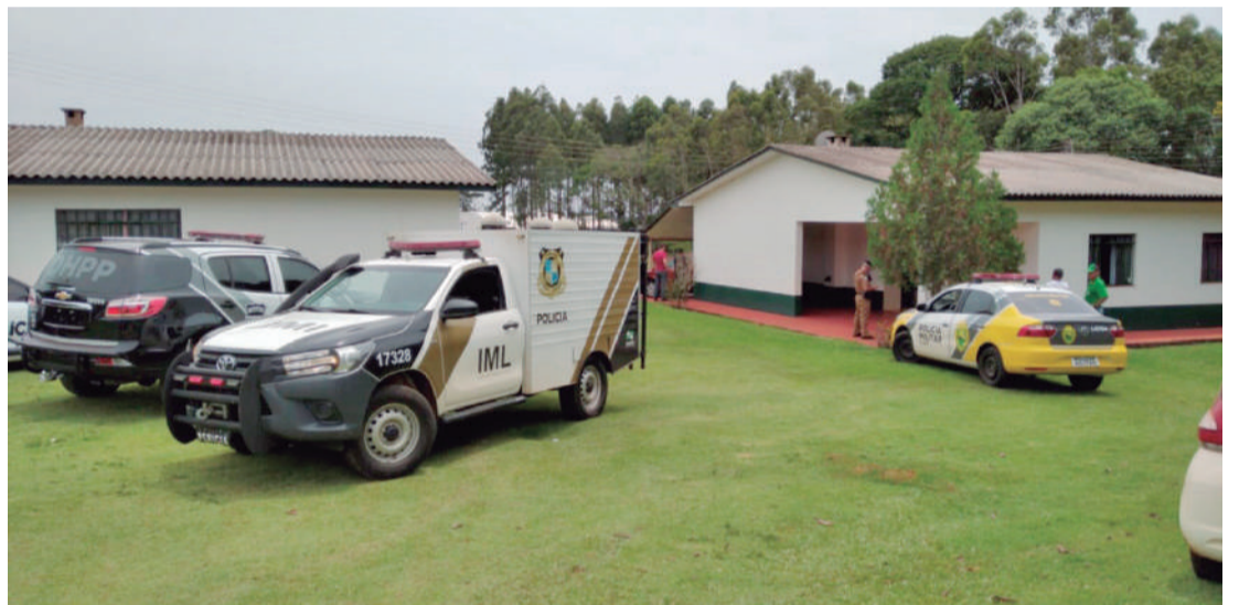
A mulher foi morta a facadas dentro de casa; bebê sobreviveu

A PM fechou cerco nas proximidades da Vila Cajati, com buscas inclusive aéreas. “Estamos utilizando drones e cães farejadores para tentar encontrar o assassino. A princípio, não é uma pessoa