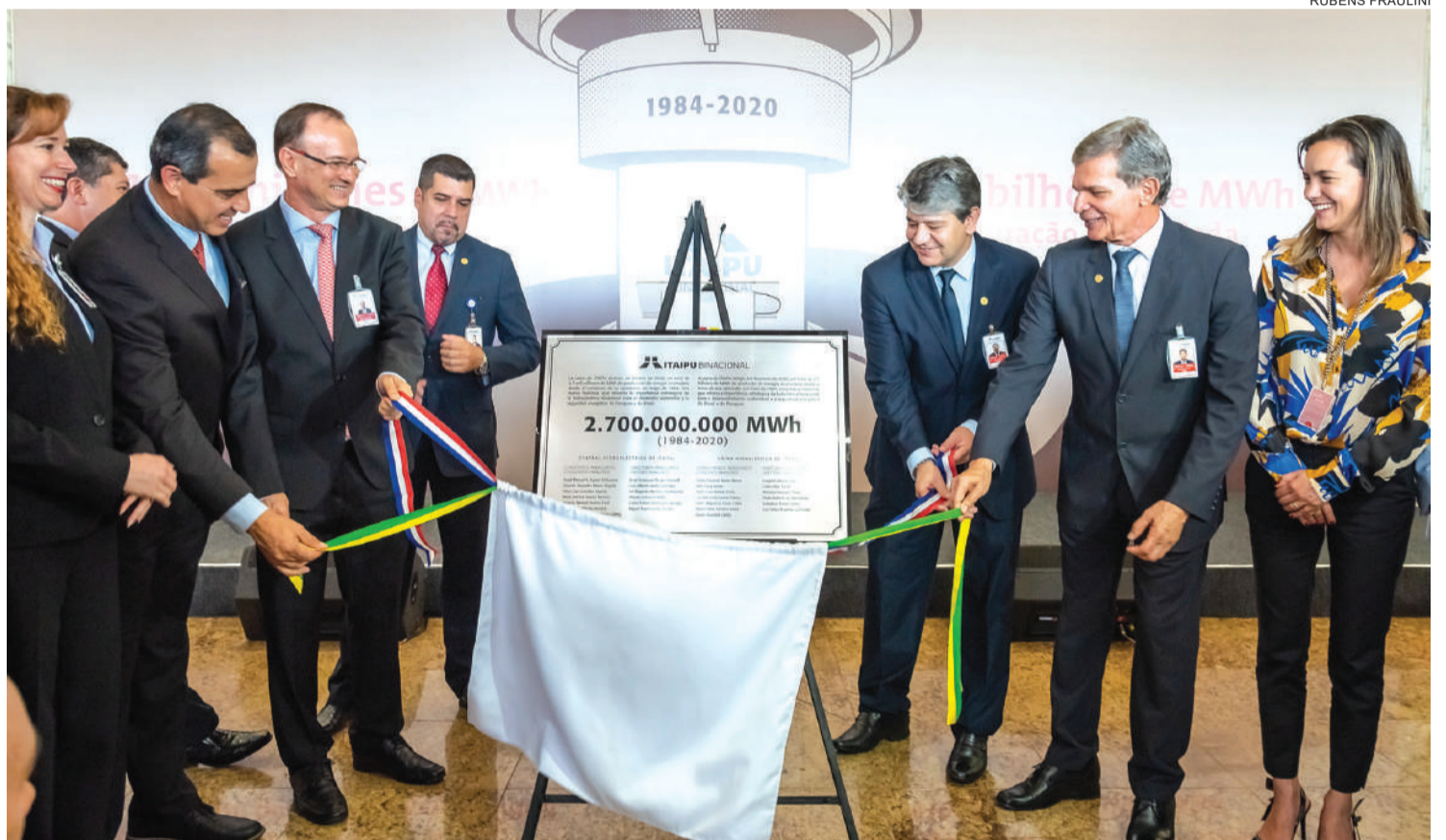
Uma placa foi confeccionada para registrar a marca histórica

Mais do que estabelecer recordes, a conquista reforça ainda mais a importância estratégica de Itaipu para as infraestruturas do Brasil e do Paraguai. “O que significa essa quantidade de energia nos surpreende. Mas o principal é saber que isso é um potencial que está à disposição do Brasil e do Paraguai e ainda tem muito a contribuir para o bem-estar e o desenvolvimento de nossos povos”, afirmou o diretor-geral brasileiro, general Joaquim Silva e Luna.