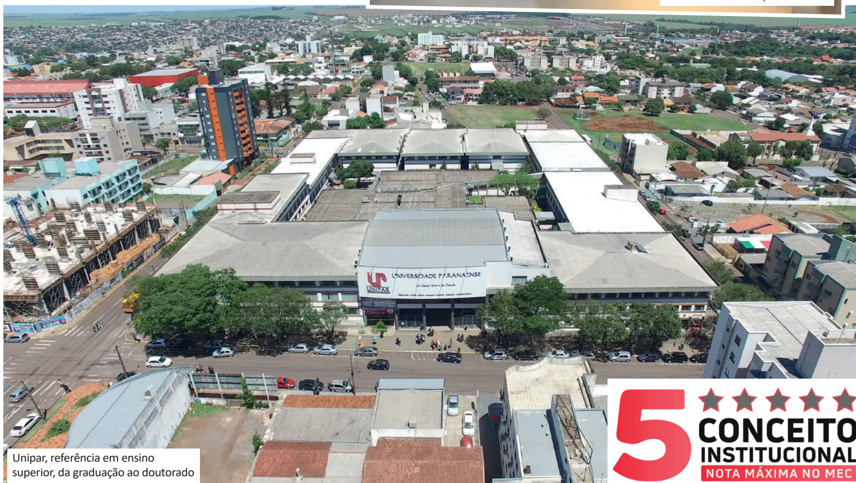
Unipar, referência em ensino superior, da graduação ao doutorado

5 ★★★★★ CONCEITO INSTITUCIONAL NOTA MÁXIMA NO MEC