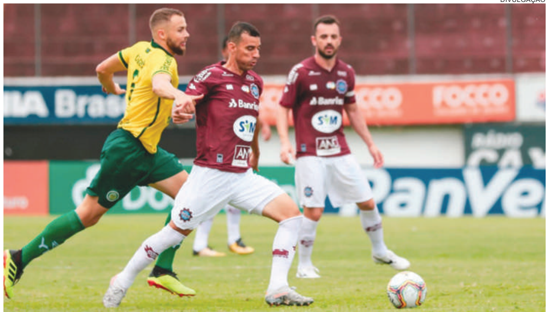
Caxias venceu o Ypiranga na semifinal, e agora encara o Grêmio

Se tudo sair como planejado para Grêmio e Internacional, os torcedores terão uma "overdose" de clássicos em 2020. Só no Gauchão, podem ser cinco Grenais, fora as outras competições do ano.