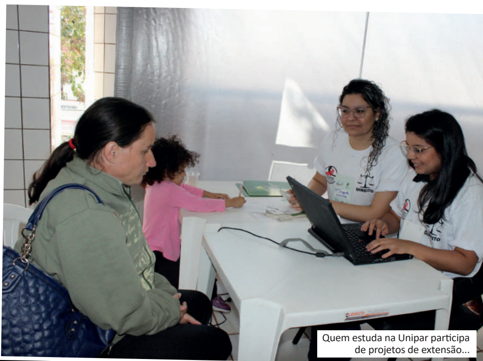
Quem estuda na Unipar participa de projetos de extensão...

Quer começar um curso superior já? Ainda dá tempo. Você pode concorrer com a nota do Enem. Quer ser especialista? Ou mestre? Ou doutor? Inscreva-se já. A Unipar tem mais de cem opções de cursos. Saiba mais em unipar.br .