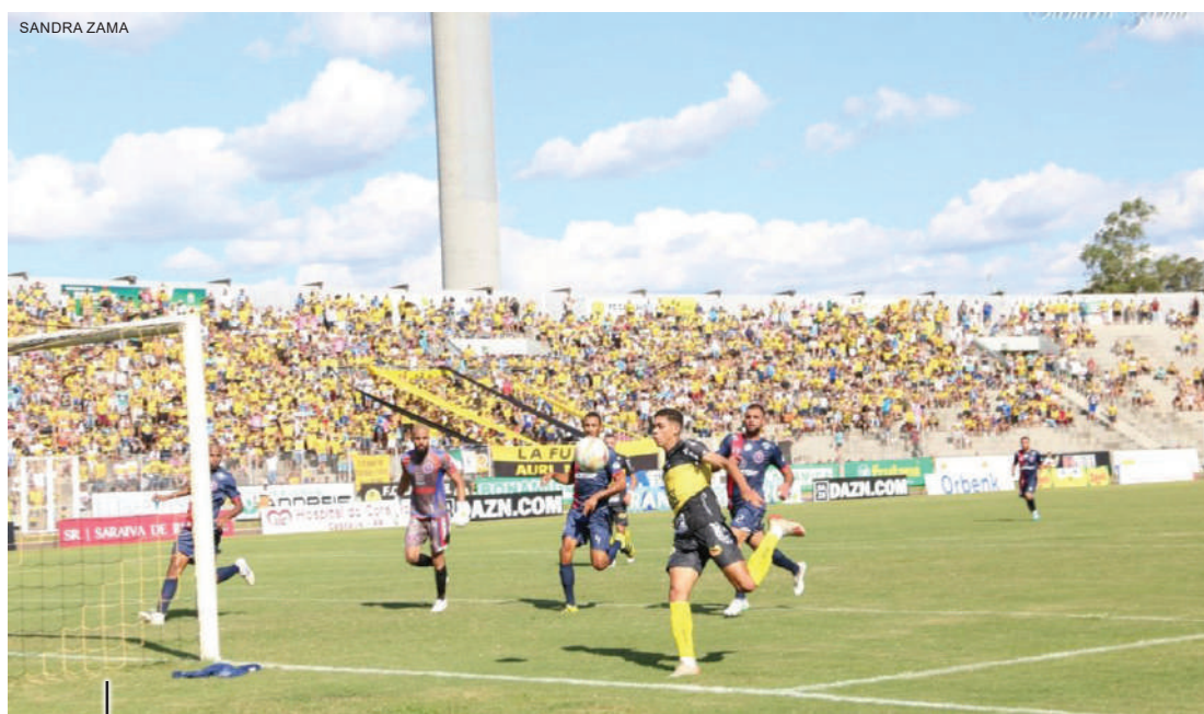
No último clássico deu empate

Já o Porco vive um momento difícil na competição. Das sete rodadas disputadas até aqui, são cinco derrotas, um empate e apenas uma vitória. Com quatro pontos conquistados, a equipe do Toledo ocupa a 11ª colocação no Paranaense 2020 e corre risco de ser rebaixado.