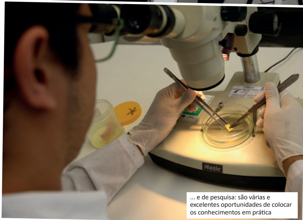
... e de pesquisa: são várias e excelentes oportunidades de colocar os conhecimentos em prática