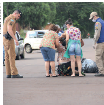
Inconformada com a perda, a mãe de Juliano precisou ser amparada por populares

Com a vítima foi encontrada uma pistola calibre 380 com munições. Muito abalada, a mãe do rapaz pedia justiça pela morte do filho.