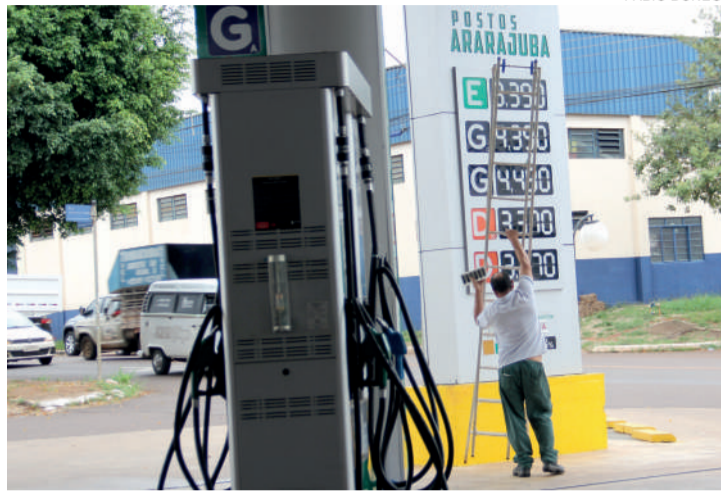
Postos remarcam preço dos combustíveis, agora para baixo

Segundo ele, a redução nos preços começou a chegar ao consumidor final na última sexta-feira (13), data do anúncio anterior