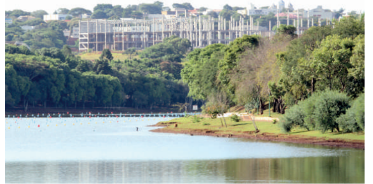
Sanepar voltou a captar água do Lago Municipal de Cascavel

Dependendo do consumo e dos volumes de água armazenados, é possível que a normalização de todo o sistema leve até três dias. Por isso, a Sanepar afirma que é imprescindível que todos economizem água, priorizando seu uso na alimentação e na higiene pessoal.