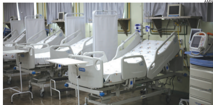
Na fronteira, estrutura só atenderá casos enviados via central

especial no HU (Hospital Universitário) e outros 60 de recuperação estão sendo finalizados no Centro de Eventos do Município.