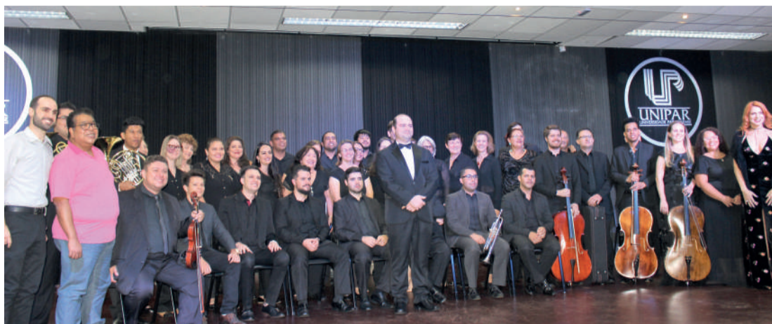
Unipar recebe Membro Vocal e Orquestra de Câmara de Cascavel

A professora explica que a Série se trata de um projeto na área lírica, aberto para alcançar toda a população. Foram apresentadas composições de Mozart e de outros artistas - italianos,