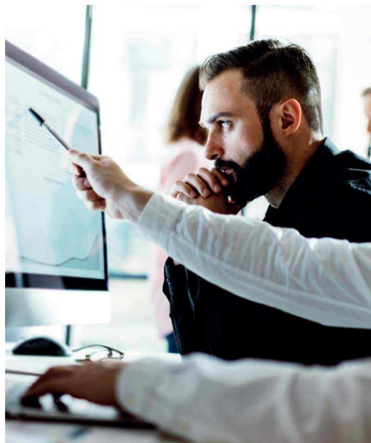
Ainda na graduação, acadêmicos são incentivados a prosseguir os estudos, porque a especialização no currículo é um diferencial importante na carreira