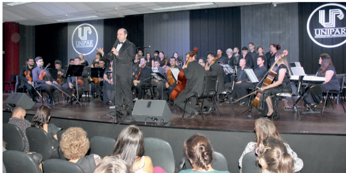
Sociedade cascavelense prestigia Série de Concertos na Unipar

finlandeses, entre outros. As óperas e as músicas clássicas falaram de amor, liberdade que exigem os que amam, meditação, superação, profundidade e tristeza.