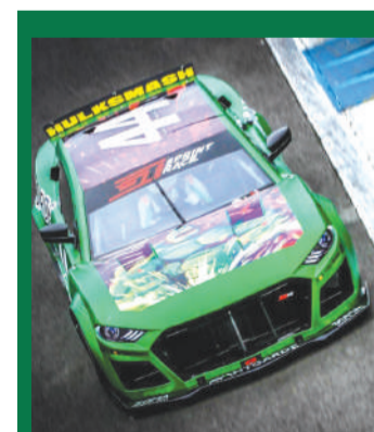
| Bandeirada 8