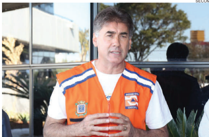
Paranhos diz que "as prefeituras serão as ferramentas da retomada"

A assinatura do estudo para a retomada econômica será na manhã do dia 30 de abril, em evento que vai reunir Acic, Amic, CDL e Sebrae. No mesmo dia, haverá a liberação de recursos para 30 startups que apresentem ações que