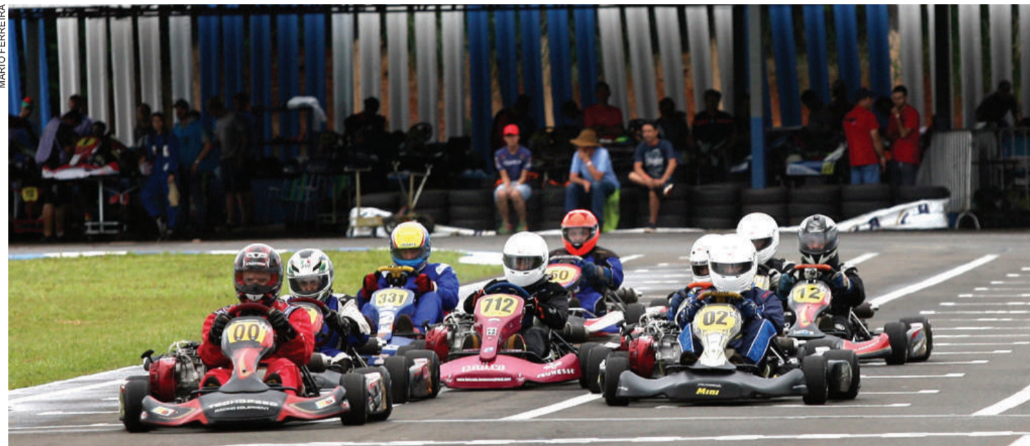
A Copa Brasil de Kart foi mantida no Kartódromo Luigi Borghesi, em Londrina, mas será em fevereiro

Um novo cenário para o esporte mundial está sendo desenhado diante da crise mundial de saúde pública, com a pandemia de coronavírus. Todos os segmentos estão se reinventando e, mais do que isso, trabalhando na busca de soluções viáveis para que os impactos, inevitáveis, sejam os menores possíveis.