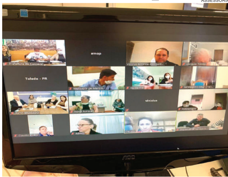
Discussão aconteceu por meio de videoconferência