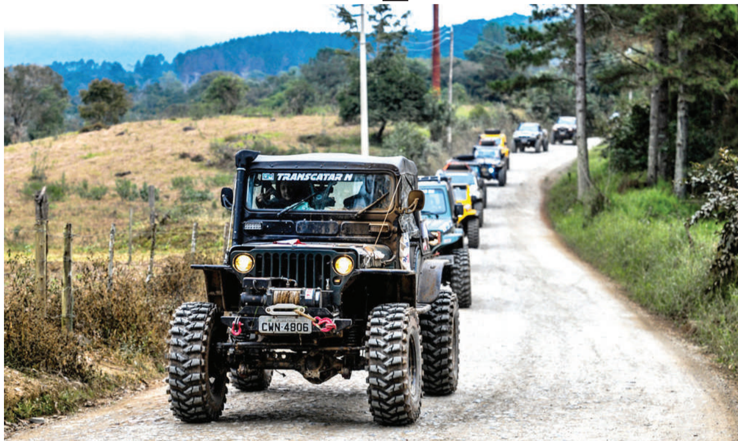
Transcatarina 2020 já conta com mais de 200 veículos inscritos