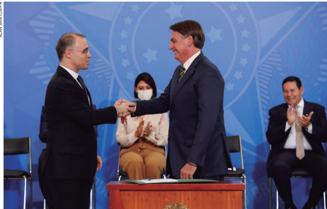
André Mendonça não poupou elogios ao presidente Bolsonaro

Justiça também prometeu mais operações da Polícia Federal. “Vamos fazer operações conjuntas. Cobre de nós mais operações da Polícia Federal, presidente da República”, disse.