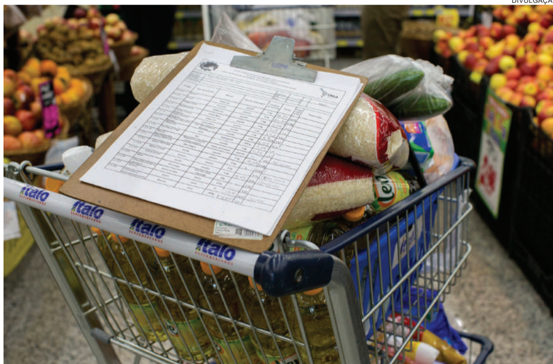
Pesquisa coleta preços de 94 produtos em 12 locais de Foz