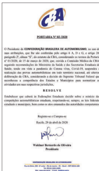
Portaria da CBA