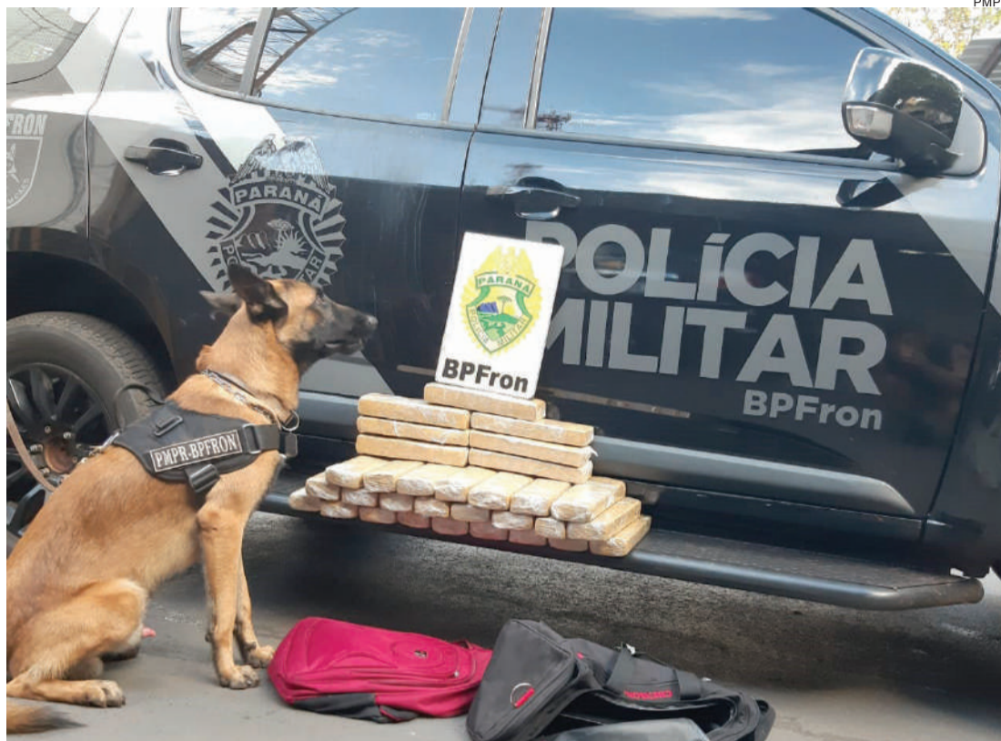
Batalhão desempenha ações especiais para combater o narcotráfico

A intensificação das abordagens e das fiscalizações se deu ainda por conta das operações colegiadas com integrantes de diversas unidades de segurança pública das esferas municipal, estadual e federal, a exemplo da Operação