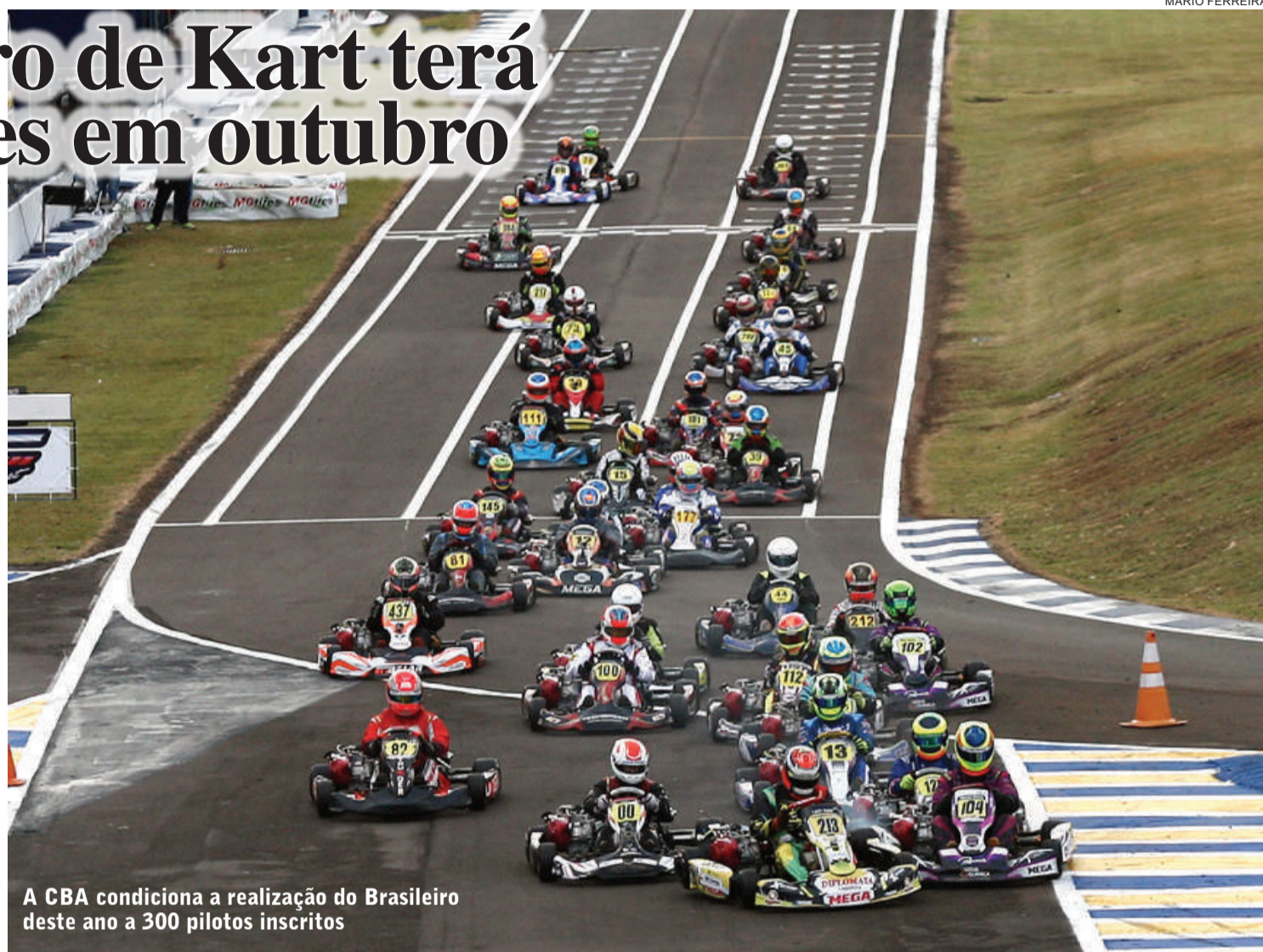
A CBA condiciona a realização do Brasileiro deste ano a 300 pilotos inscritos

pandêmica em que o planeta se encontra, a CNK determinou que, findadas as inscrições do primeiro lote, no dia 5 de novembro, será feita uma apuração dos números e, com isso, acontecerão as definições sobre o formato do campeonato. As categorias com menos de dez pilotos inscritos serão automaticamente canceladas e as demais levarão em conta as seguintes condições: