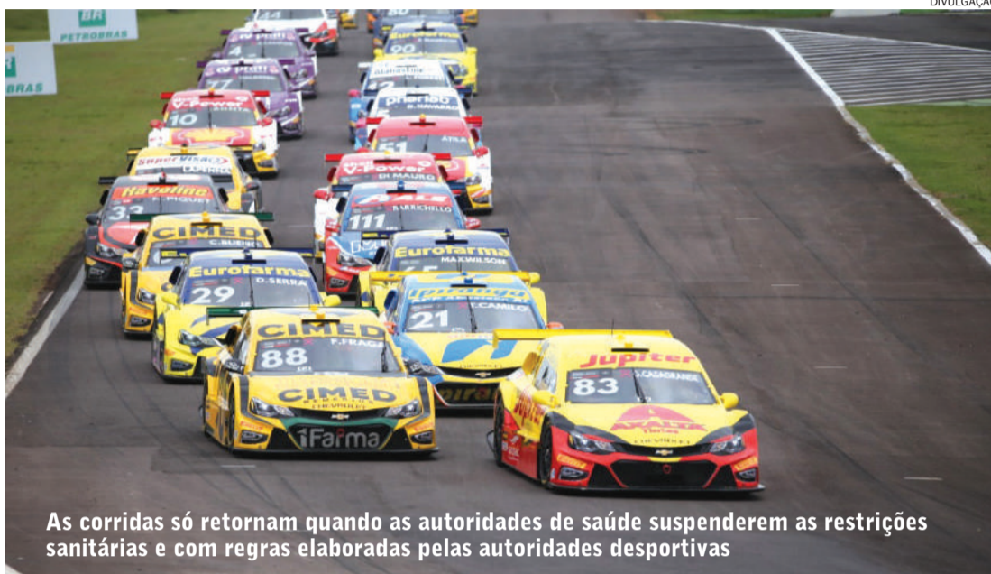
As corridas só retornam quando as autoridades de saúde suspenderem as restrições sanitárias e com regras elaboradas pelas autoridades desportivas

8 - Colaboradores acima de 60 anos: preferencialmente não devem ser inseridos no atendimento e assistência a casos suspeitos ou confirmados. Devem ser realocados de função, em atividades de gestão ou apoio, de forma a minimizar a chance de contato com pessoas ou ambientes contaminados.