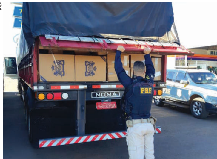
Carreta estava carregada de cigarro de origem ilegal

Preso em flagrante, o contrabandista disse que saiu de Sete Quedas (MS) e que pretendia levar a carga até Curitiba.