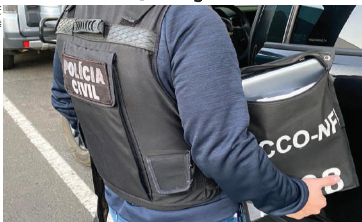
Documentos, arquivos digitais e equipamentos de informática apreendidos auxiliarão na busca de provas

Conforme o Ministério Público, verificou-se que o projeto básico não foi