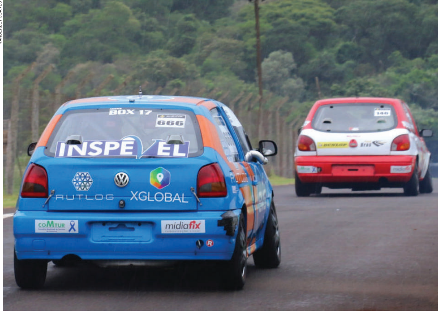
O grid da Cascavel de Prata acolherá os modelos de carros da categoria Marcas produzidos entre 1993 e 2017

Marcada para 1º de novembro no Autódromo Internacional Zilmar Beux, a 34ª edição da Cascavel de Ouro terá uma programação automobilística intensa. Além das duas corridas preliminares da Gold Classic, cujo grid será formado por 50 exemplares de modelos clássicos e antigos, o evento terá como novidade em 2020 a primeira edição da Cascavel de Prata, que vai premiar os pilotos vencedores com R$ 50 mil.