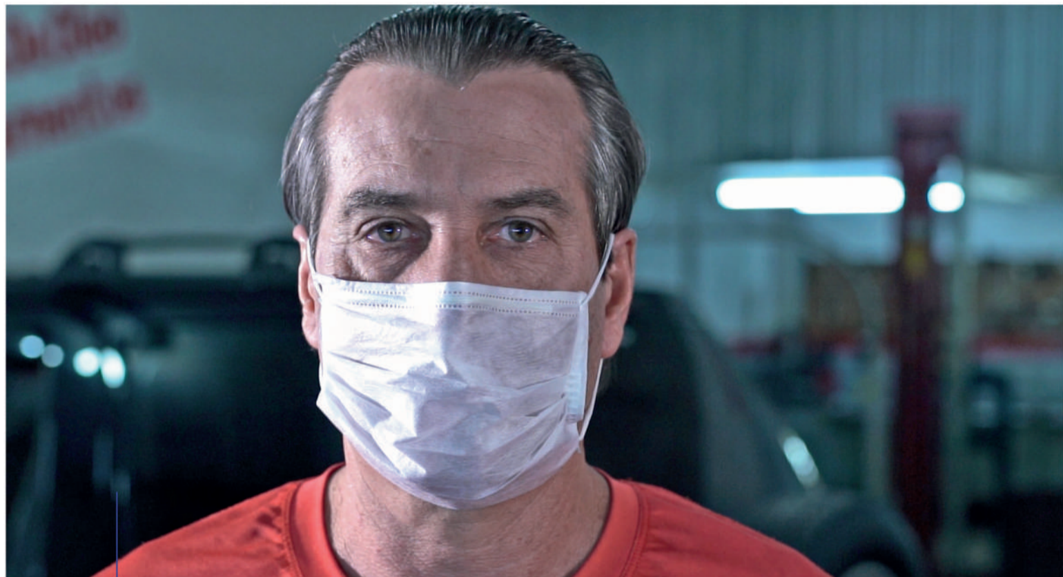
IDECIR PRIMON MECÂNICO

CASCAVEL ESTÁ UNIDA! É RESPONSÁVEL! E AVANÇA PARA VENCER O CORONAVÍRUS!