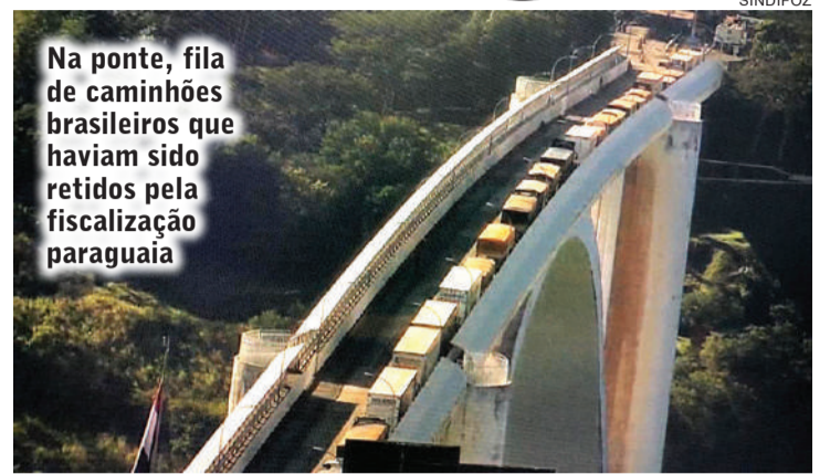
Na ponte, fila de caminhões brasileiros que haviam sido retidos pela fiscalização paraguaia

O Sindifoz e outras entidades do setor tentam uma negociação com o Codena e o Ministério dos Transportes Paraguaio para mudar a situação, pois temem uma greve da categoria. “Nós tentamos negociar com os órgãos responsáveis, enviamos uma carta para o Codena e um ofício ao ministro dos transportes e esperamos que nos próximos dias a situação possa ser resolvida porque já tivemos ameaça do lado brasileiro de tentar impedir a ida de caminhões para o lado paraguaio, já que o país segura eles lá dessa forma... tememos que a greve possa se concretizar caso a situação não mude. Os caminhoneiros brasileiros podem parar devido a esse excesso de