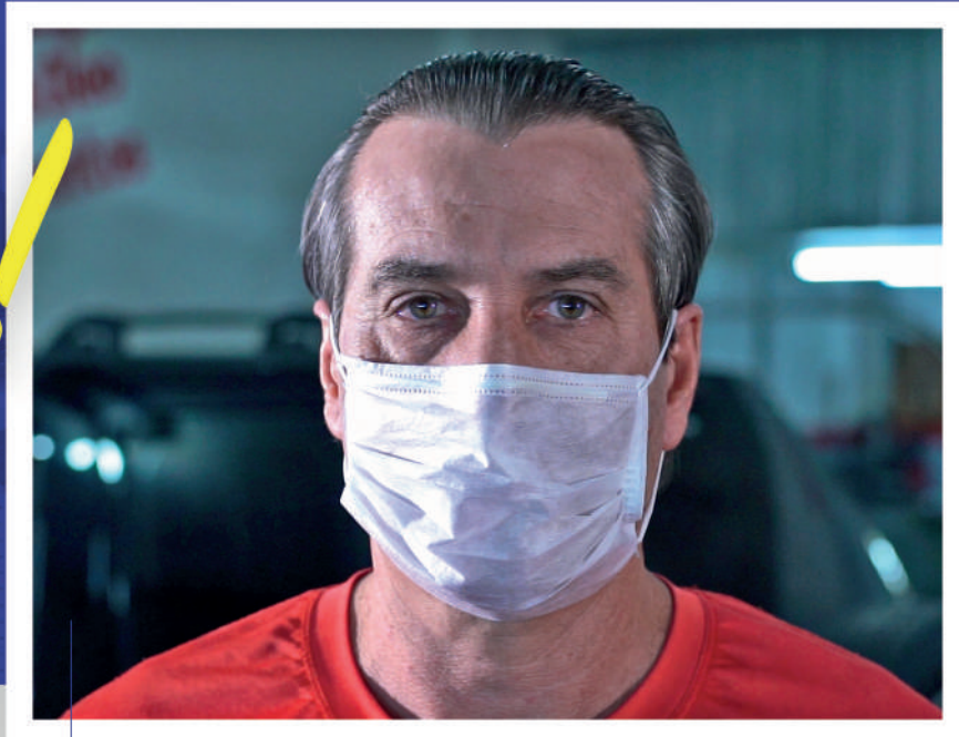
IDECIR PRIMON MECÂNICO

CASCAVEL ESTÁ UNIDA! É RESPONSÁVEL! E AVANÇA PARA VENCER O CORONAVÍRUS!