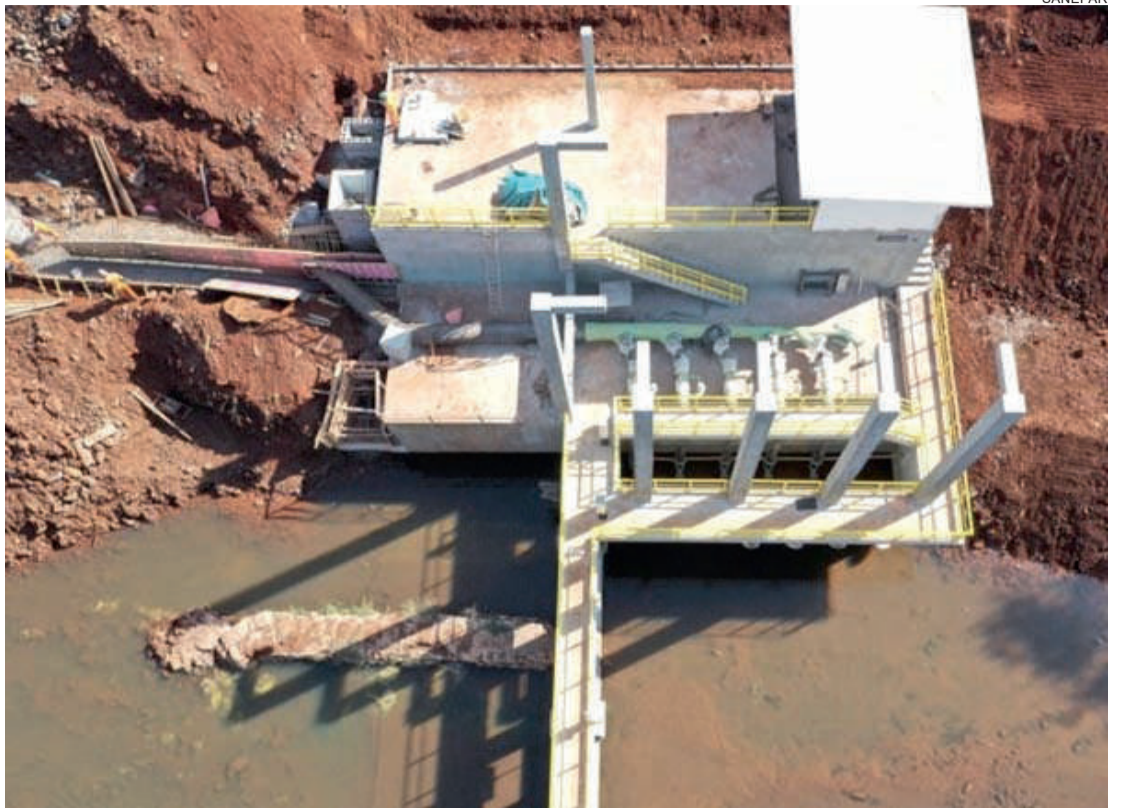
Em Cascavel, avança a obra para captação do Rio São José

Santa Tereza do Oeste e Terra Roxa também têm recursos para água e esgoto. Para Santa Tereza está sendo licitada a primeira etapa de implantação do sistema de esgoto sanitário. Com as duas fases previstas, será estendida a rede coletora para 85% dos moradores da área urbana, até 2025. O sistema vai contar com uma