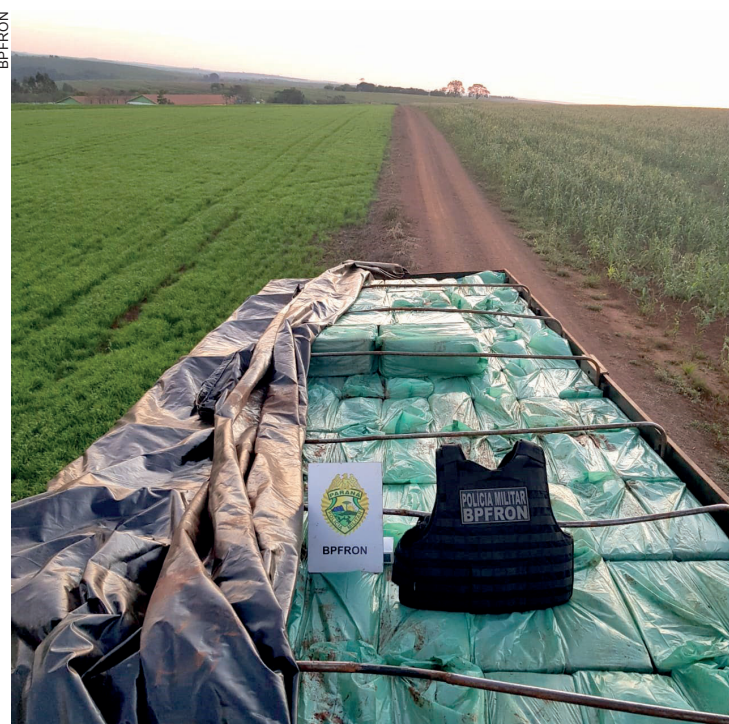
Caminhão estava abandonado recheado de cigarros de origem ilegal

Uma hora depois, outra equipe da PRF, após receber denúncia de contrabando, foi até Marechal Cândido Rondon e lá encontrou a carreta rodotrem com as características denunciadas. Os policiais de aproximaram para fazer a abordagem, porém, o condutor acelerou e tentou jogar o veículo sobre a viatura, que conseguiu evitar a colisão, mas a carreta colidiu em uma árvore e atingiu uma viatura da Delegacia da Polícia Civil que estava estacionada na rua. O motorista saltou e tentou fugir, mas foi detido. Os policiais encontraram cerca de 750 mil cartelas de cigarros.