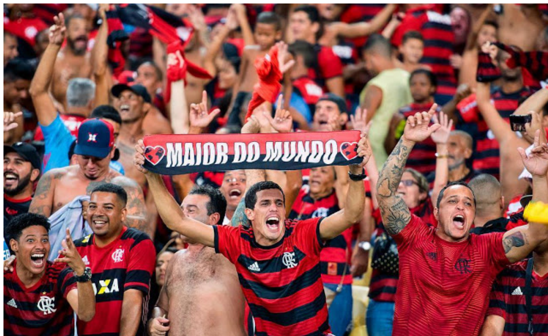
Nação rubro-negra é uma das maiores do mundo