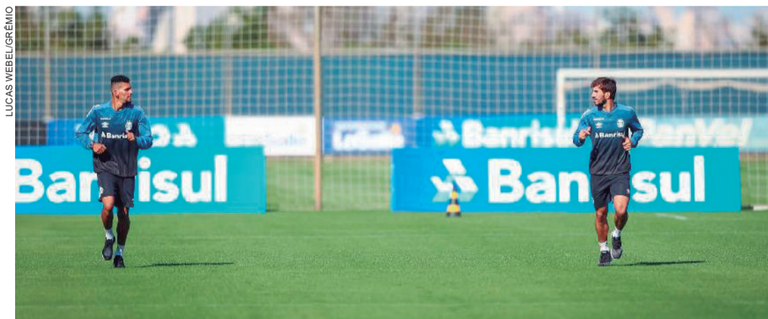
Time concluiu treinos físicos com distanciamento em Porto Alegre

Em uma nota oficial divulgada no início da tarde de ontem, a diretoria do Grêmio informou que o time está deixando Porto Alegre e se transferindo para Santa Catarina, onde deve começar os treinos no Centro de Treinamento do Criciúma.