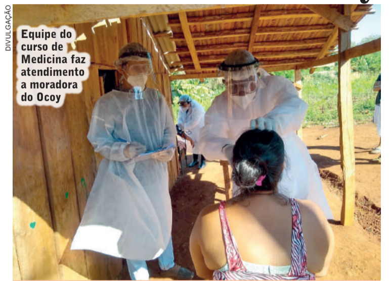
Equipe do curso de Medicina faz atendimento a moradora do Ocoy