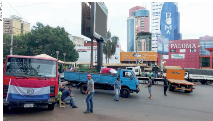
Brasileiros estão há dias retidos no Paraguai, sem comida nem água

As consequências da paralisação podem ir de desabastecimento até uma mudança de mercado. “Pode haver