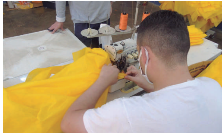
São produzidos máscaras, jalecos, uniformes, escafandros, toucas e outros itens dentro das unidades prisionais

“Aos poucos, conforme conseguíamos, aumentávamos a confecção e rapidamente pudemos disponibilizar máscaras internamente e ainda enviar parte da produção prefeituras e diversas casas de saúde do Estado, como os Hospitais Universitários de Cascavel e de Londrina, que são referências no atendimento de casos de covid-19 nas regiões”, destaca o secretário