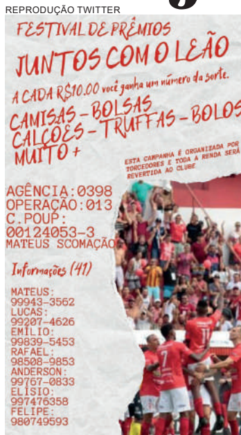
Torcida do Rio Branco sorteia prêmios para ajudar o time

Se o jogo ocorrer no litoral, o time fica hospedado em Paranaguá. Também existe a possibilidade de a partida ser realizada em Curitiba ou em Ponta Grossa, também no próximo sábado.