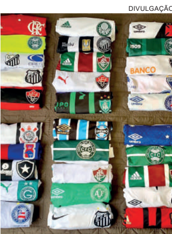
Serão sorteados 10 kits com camisas dos times de futebol

A troca dos números é feita pelo email contato@apafpr.esp.br.