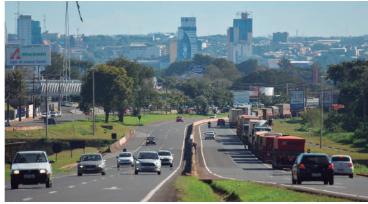
Novo sistema de iluminação viária será feito em Foz do Iguaçu, Santa Terezinha de Itaipu e São Miguel do Iguaçu, em um total de 20 km.

A nova iluminação segue o conceito de “rodovias inteligentes”, que tem o objetivo de reduzir os acidentes fatais nas estradas.