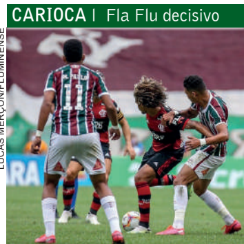
CARIOCA | Fla Flu decisivo

Por muito pouco o reinício do Campeonato Paranaense não foi confirmado ontem, após a liberação da quarentena pelo governo do Estado. Duas coisas impediram. A primeira, que Paranaguá não está liberada do lockdown. A segunda, é que alguns dirigentes de clubes marcaram reunião para amanhã com o secretário estadual da Saúde, Beto Preto, o que afetou a possibilidade de oficialização.