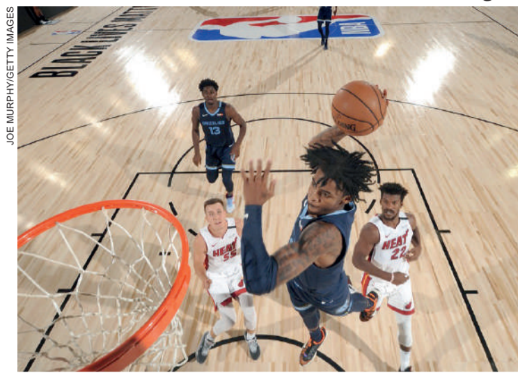
Ja Morant, dos Grizzlies é um dos destaques da temporada

Os 22 times irão jogar em três ginásios dentro do parque - o Arena, o Field House e o Athletic Center. Serão até seis jogos por dia em cada uma delas. Cada