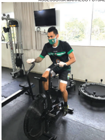
Maioria dos times segue treinando apenas em academia

Basicamente, os times serão divididos em dois grupos com sete equipes, restando definir se os jogos serão dentro do grupo - seis datas e uma equipe folgando -, ou grupo X grupo, o que daria um total de sete datas até classificar os times para os playoffs.