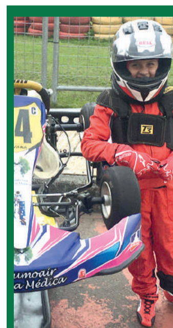
| Bandeirada 10