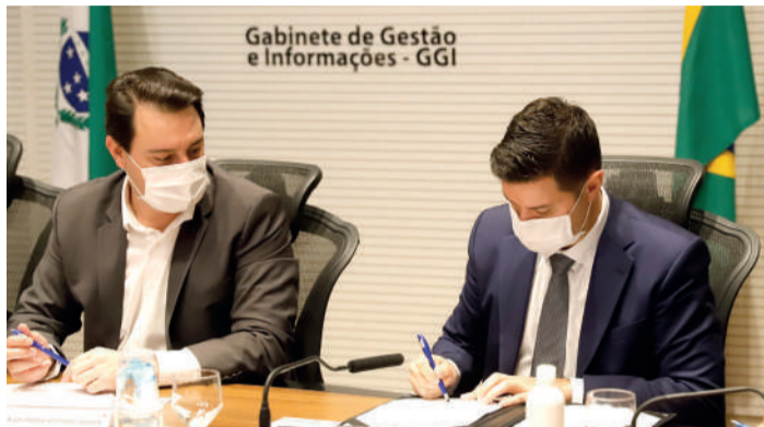
Gabinete de Gestão e Informações - GGI