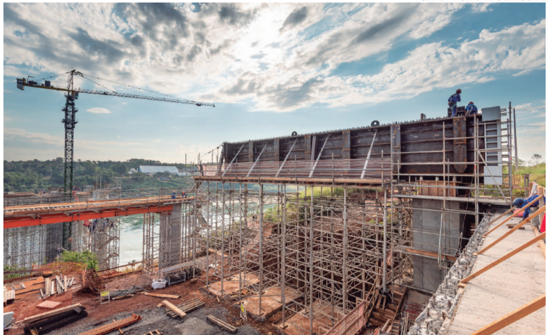
Previsão de conclusão é meados de 2022

A nova ponte entre Brasil e Paraguai é uma obra do governo federal, com gestão do governo do Estado (por meio do Departamento de Estradas de Rodagem - DER) e recursos da Itaipu Binacional. Estão sendo investidos na construção aproximadamente R$ 463 milhões, considerando a estrutura, as desapropriações e a criação de uma perimetral no lado brasileiro.