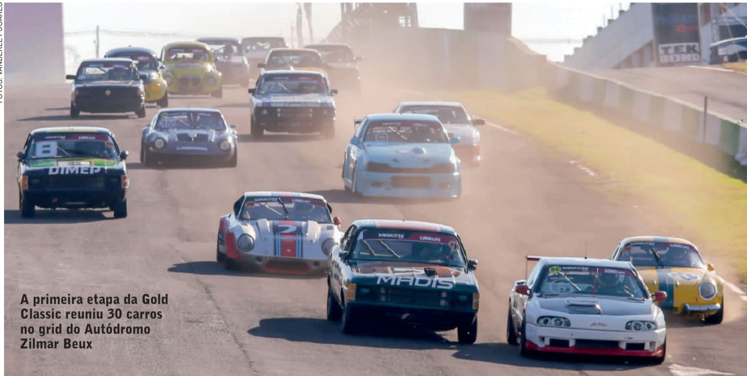
A primeira etapa da Gold Classic reuniu 30 carros no grid do Autódromo Zilmar Beux

A Gold Classic realizou a primeira etapa da temporada 2020 no último sábado, no Autódromo Zilmar Beux. Participaram 30 carros, representando os estados do Paraná, de São Paulo, do Rio de Janeiro, de Santa Catarina e do Rio Grande do Sul.