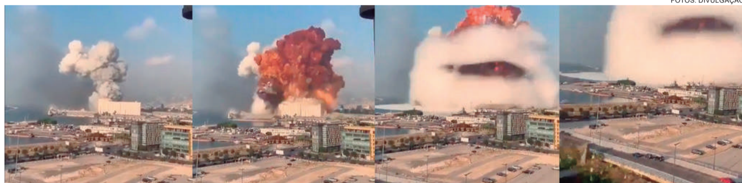
Explosão maior aconteceu quando muitas pessoas filmavam o local

Em um duro pronunciamento na TV, Diab disse que aqueles