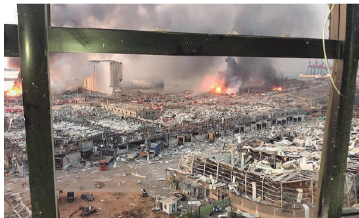
Quilômetros de extensão foram dizimados

“Vi uma bola de fogo e de fumaça subindo por Beirute. As pessoas estavam gritando e correndo, sangrando. Varandas foram arrancadas de edifícios. O vidro dos prédios quebrou e caiu nas ruas”, disse uma testemunha à Reuters.