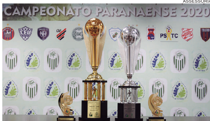
Troféus do estadual foram apresentados pela Federação

A edição 2020 marca a 19ª final entre os dois times. Até agora, são nove vitórias para cada lado. O Athletico chega com a vantagem do empate após a vitória na primeira partida. "A gente espera reverter isso no próximo jogo para sair com nosso objetivo alcançado. É o último jogo do