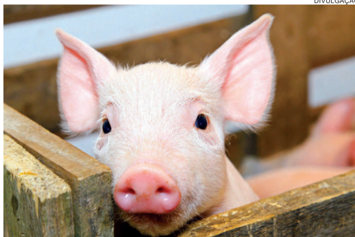
A SUINOCULTURA RESPONDE POR 30% DO VBP DE TOLEDO