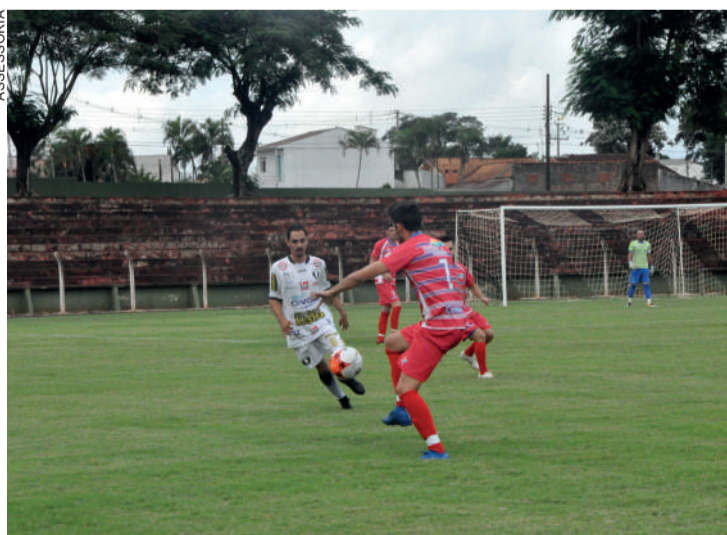
Futebol amador tenta fazer retomada regional

realidade diferente em relação à propagação do novo coronavírus, por isso precisamos ouvi-los e, com base nas informações colhidas,