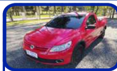
VW SAVEIRO 1.6 CS 12/13 LANÇE A PARTIR DE R$ 10.800,00