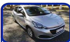
PEUGEOT 208 ACTIVE MT 17/18 LANÇE A PARTIR DE R$ 16.600,00

FIAT IDEA ATTRACTIVE 1.4 14/15 LINEA ABSOLUTE DUAL 08/09 SIENA 1.4 TETRA FUEL 09/10 PALIO ELX FLEX 07/08 UNO VIVACE 1.0 14/14 UNO VIVACE 1.0 14/14 UNO VIVACE 1.0 14/14 UNO VIVACE 1.0 14/14 UNO VIVACE 1.0 14/14 UNO VIVACE 1.0 15/16 UNO VIVACE 1.0 14/15 UNO WAY 1.0 14/14 WEEKEND TREKKING 15/16