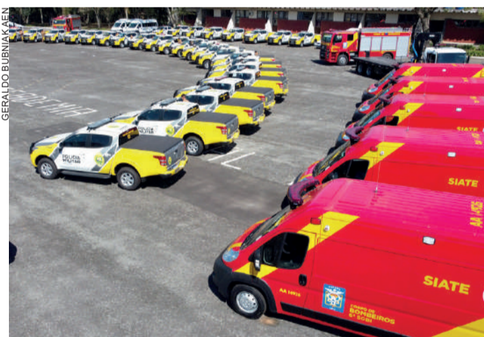
Foram entregues 58 veículos, incluindo caminhonetes, vans (ambulâncias) e caminhões

Foram entregues 58 novos veículos, incluindo caminhonetes, vans (ambulâncias) e caminhões, um investimento de R$ 6,8 milhões. Essa foi a sétima entrega de viaturas neste ano - a