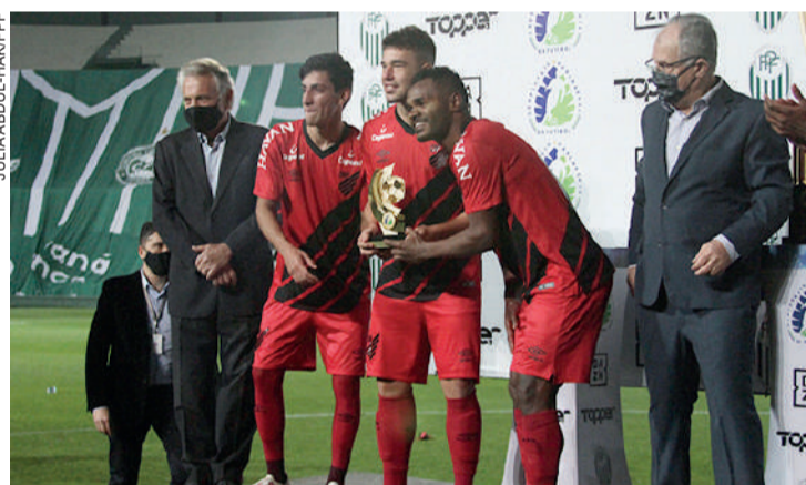
Site da FPF só cita os atleticanos como artilheiros