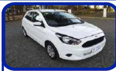
FORD KA SE 1.0 HA 15/15 LANÇE A PARTIR DE R$ 13.900,00

Transmissão ao vivo pela internet para licitantes cadastrados.