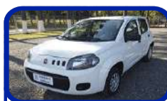
FIAT UNO VIVACE 1.0 15/16 LANÇE A PARTIR DE R$ 10.300,00

Condições de venda, relação completa dos veículos e fotos, acesse: