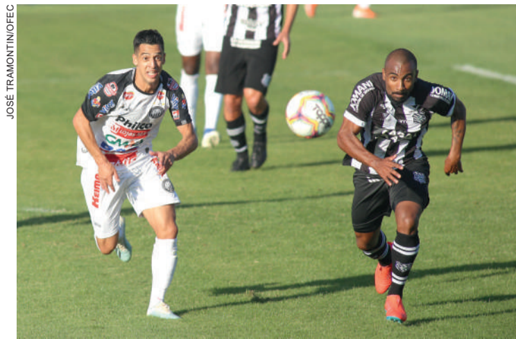
Operário pode ser líder caso vença a partida de hoje

“A movimentação fluiu, colocamos a bola no chão, e não só no terceiro gol, como em outras chances também. Nós conseguimos finalizar as jogadas e isso foi importante”, disse o técnico em análise após