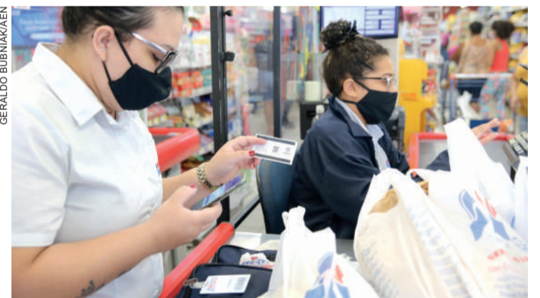
Mais de 500 mil cartões foram usados em todo o Estado