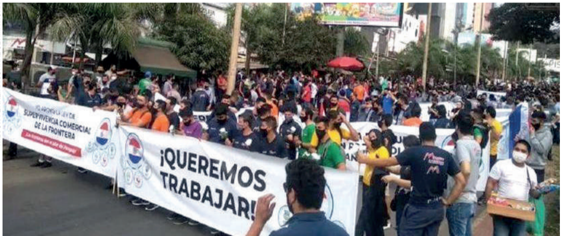
Manifestantes exigem plano de reabertura das fronteiras

Ele denuncia ainda que, enquanto os comércios formais foram afetados pela situação, o contrabando ganhou força e não há ações governamentais suficientes para coibir. “As fronteiras do Paraguai estão com muitíssimos problemas, estão sangrando e o governo não tem planos para uma solução. As micros e as pequenas empresas estão em crise: 70% delas estão a ponto de falir e, no leste do país, temos uns 10% que não vão reabrir”, lamentou o empresário.