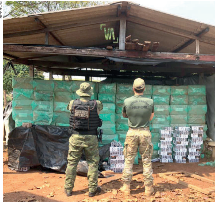
Depósito ficava em uma propriedade rural

Altônia - Na última sexta-feira (4), durante patrulhamento na zona rural do Município de Altônia, equipes policiais identificaram uma propriedade que servia como depósito de cigarros paraguaios.