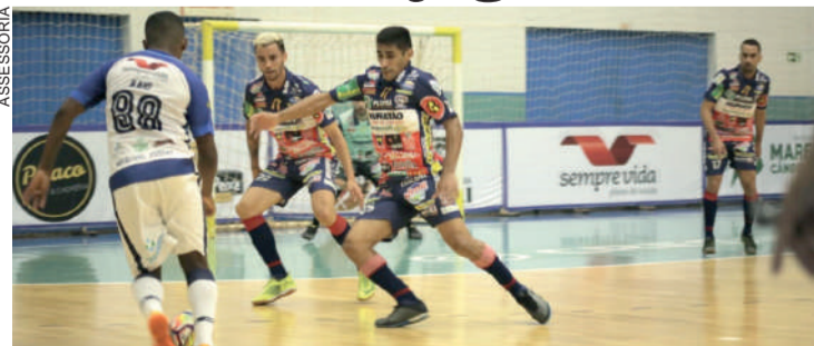
Time segue invicto nas três competições que disputa

O primeiro desafio é neste domingo, às 20h15, na cidade de Palmas, pela Liga Paraná. Depois, o time parte para o Rio Grande do Sul, onde fará duas partidas pela Liga Nacional. Na terça-feira, enfrenta o Carlos Barbosa, às 16h. Na quinta, o time chega a Erechim para