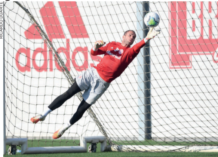
Líder do Brasileirão, Inter terá dois jogos em casa

Renzo Saravia, Edilson, Gabriel Boschilia e Thiago Galhardo podem retornar ao time titular dentro do esquema de revezamento. Musto, com