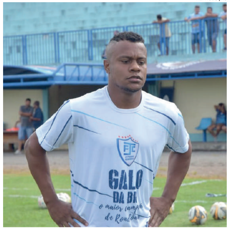
Watthimem, do Ji-Paraná; o pai era fã do Watchman, mas o cartorário... uma das muitas curiosidades da Série D

Por fim, o confronto das 17h, Baré (RR) x Ypiranga (AP), no Estádio Canarinho, em Boa Vista. Os donos da casa foram notícia no início do ano por entrarem em campo com máscaras e deixarem o gramado logo em seguida como protesto pelo campeonato estadual estar prosseguindo quando todos os outros já haviam parado. O classificado entra no Grupo A2 - Moto Clube (PA), River (PI), Sinop (MT), São Raimundo (RR), Altos (PI), Santos (AP) e Juventude (MA).