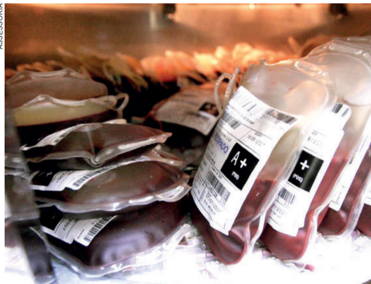
Plasma de recuperados pode ajudar a salvar pacientes graves

No dia 26 de agosto, o Hospital Ministro Costa Cavalcanti realizou a primeira transfusão de plasma hiperimune de Foz do Iguaçu e região para tratamento de paciente com a covid-19. O