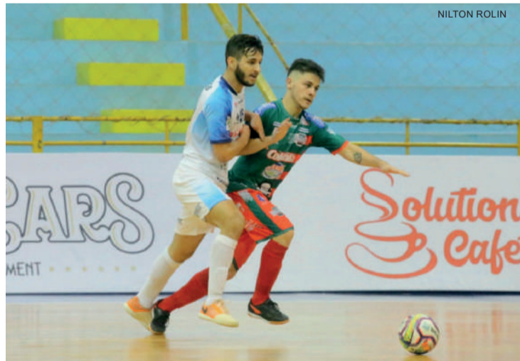
Toledo perdeu para o Foz, que pode se tornar líder esta noite

Toledo - Não foi boa a estreia do Toledo Futsal na Série Ouro do futsal paranaense. Depois de ter duas partidas adiadas porque alguns atletas terem sido contaminados pelo coronavírus, o time foi derrotado pelo Foz Cataratas por 3 a 2, em partida realizada no Ginásio Costa Cavalcante. A chance de recuperação do Toledo será no próximo dia 20, quando o time recebe o Siqueira Campos.