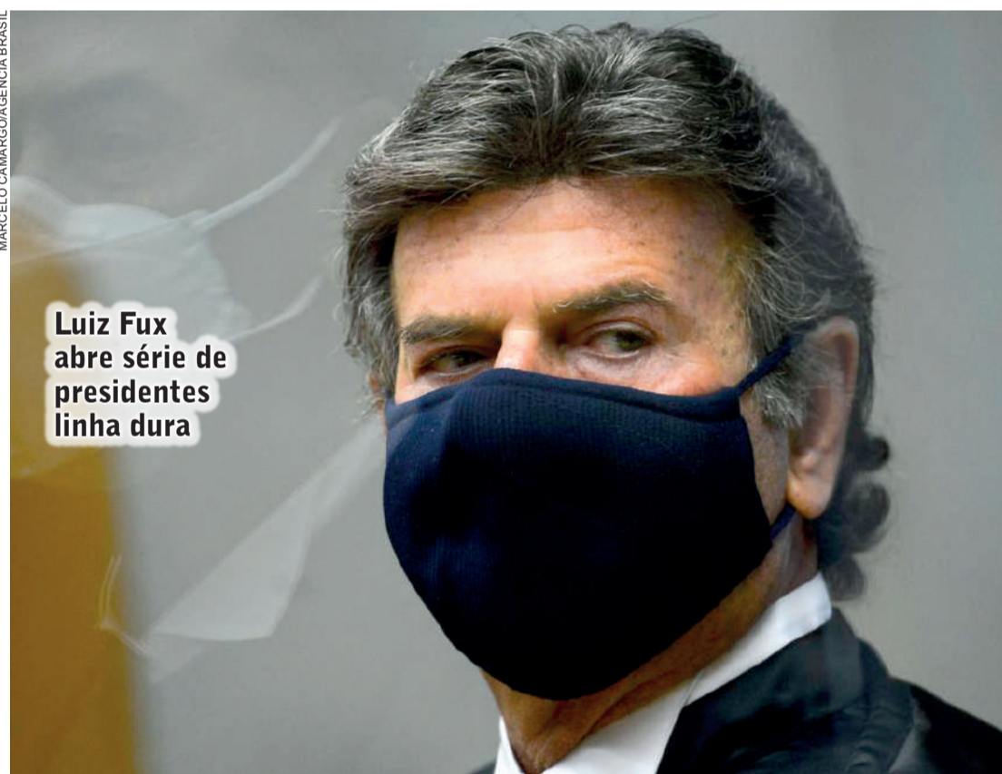
Luiz Fux abre série de presidentes linha dura

“Não mediremos esforços para o fortalecimento do combate à corrupção, que ainda circula de forma sombria em ambientes pouco republicanos em nosso País. Como no mito da caverna de Platão, a sociedade brasileira não aceita mais o retrocesso à escuridão e, nessa perspectiva, não admitiremos qualquer recuo no enfrentamento da criminalidade organizada, da lavagem de dinheiro e da corrupção. Aqueles que apostam na desonestidade como meio de vida não encontrarão em mim qualquer