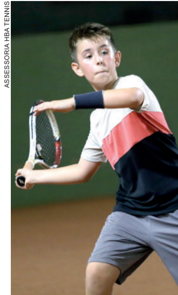
Atletas de Toledo se preparam para a retomada da temporada

As inscrições para o Friends Open terminam no dia 17 de setembro com exceção da 1ª classe, que poderá ser feita até 48 horas antes do início do torneio e poderá trazer nomes importantes do cenário estadual.