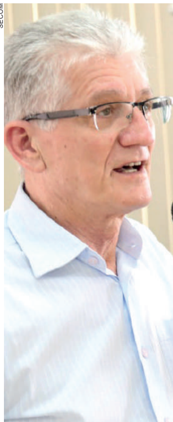
Ortigara ressalta "horizonte comercial"

Cascavel - O secretário de Estado da Agricultura e Abastecimento, Norberto Ortigara, esteve em Cascavel nessa quinta-feira para visitar a edição de inverno do Show Rural Coopavel. "Ao visitar e ter contato com as novidades apresentadas, percebo com clareza que o trigo pode se tornar, ao lado da soja e do milho, uma das commodities protagonistas de boas safras no Brasil".