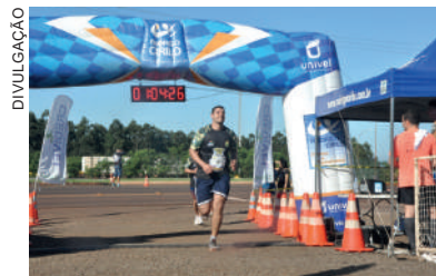
Prova será teste para futuros eventos

“Não teremos pódio ou qualquer cerimônia pós-corrida. Tudo para evitar aglomeração. Com o número reduzido de participantes, será mais fácil controlar isso”, completa. A corrida será realizada no domingo, a partir das 8h, com um total de 4km.