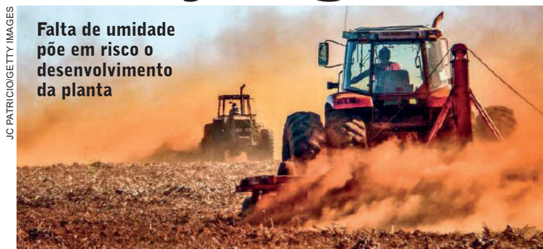
Falta de umidade põe em risco o desenvolvimento da planta