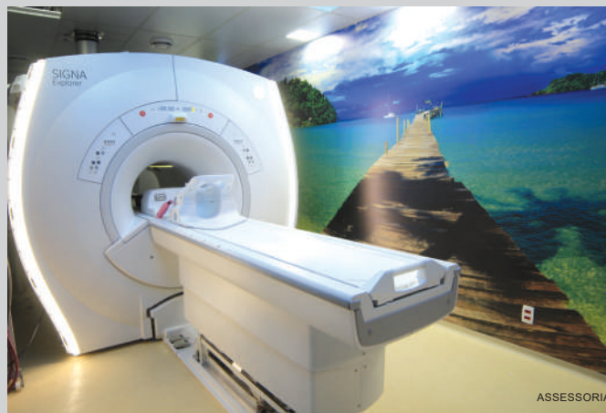
Equipamento de R$ 3,5 milhões pode ajudar a zerar fila por exame