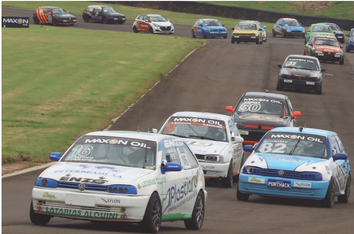
A Cascavel de Prata terá na pista carros fabricados de 1997 a 2017

Na última semana, a organização do evento confirmou a manutenção da data da Cascavel de Ouro e anunciou que a Cascavel de Prata - voltada exclusivamente a modelos já fora de linha de produção e fabricados entre 1997 e 2017