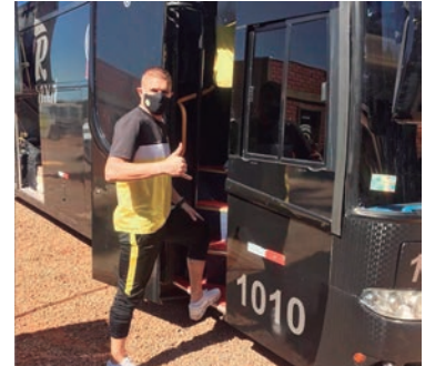
Delegação do FC Cascavel vai embarcar durante a madrugada