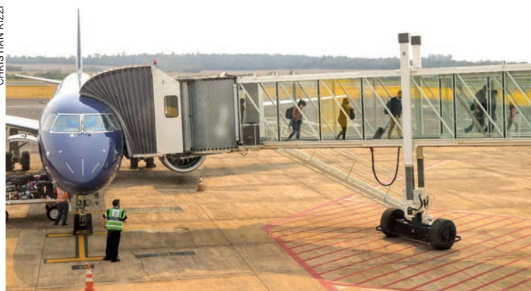
Volta dos voos anima e impulsiona a retomada do turismo na fronteira

Outra companhia aérea que inicia voos para Foz do Iguaçu em outubro é a Voepass (antiga