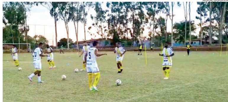
FC Cascavel fecha preparação ontem em Araraquara