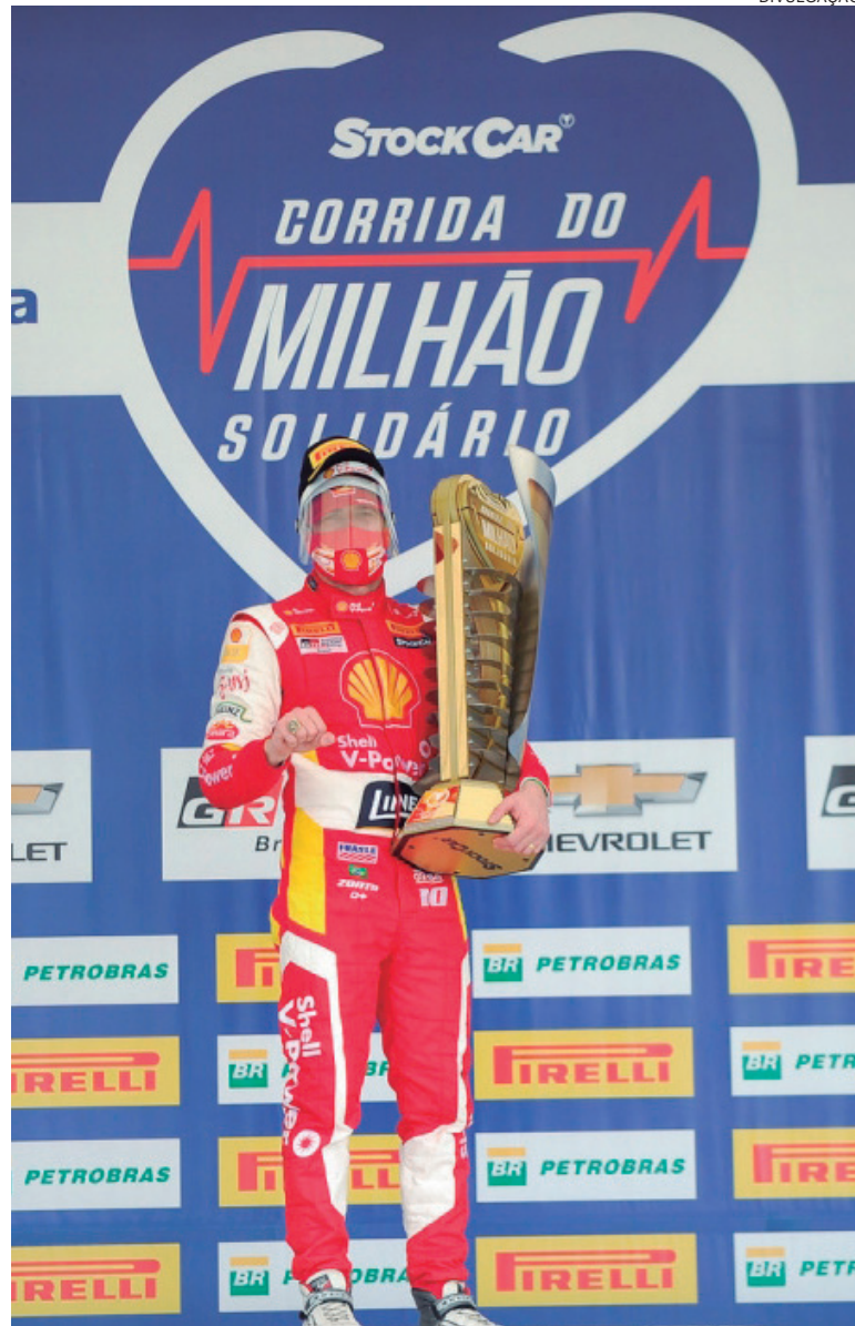
O paranaense Ricardo Zonta, vencedor da Corrida do Milhão, estará amanhã na Uopecan