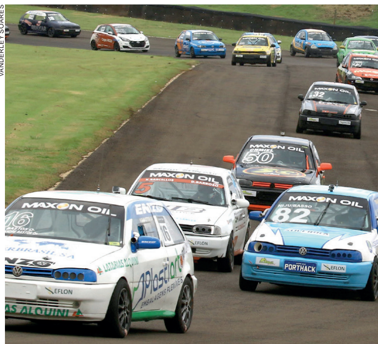
O primeiro dia de treinos da Cascavel de Ouro colocará na pista praticamente todos os inscritos na prova

Já a 34ª edição da Cascavel de Ouro está marcada para domingo, com largada às 11h30 e com três horas de duração.