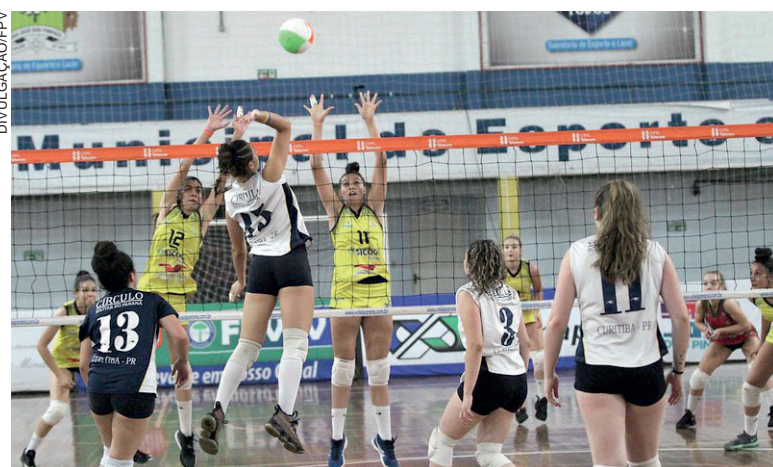
Equipes do oeste disputam duas vagas nas semifinais

esta quinta-feira são: 9h - Medianeira x Toledo/Prati Donaduzzi/Avotol; 11h30 - AABB Cascavel x Vôlei Marechal,