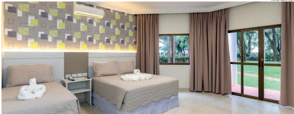
Foz possui infraestrutura completa para receber os turistas

O processo de retomada do turismo em Foz do Iguaçu conta com o apoio da campanha Vem Pra Foz, promovida pela Itaípu Binacional com apoio do trade turístico do Destino Iguaçu. A ação teve como foco inicial o estímulo ao turismo regional e depois foi responsável pela criação do aplicativo Foz com Desconto, uma plataforma para a venda de atrativos, produtos e serviços com condições especiais. Saiba mais em: https://turismoitaipu.com.br/vemporafoz/ .