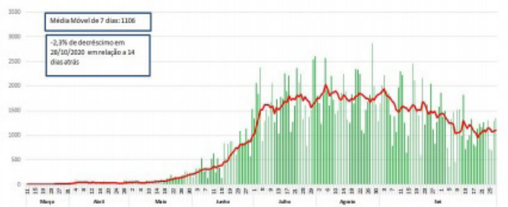
Fonte: Dados de casos confirmados de residentes no Paraná consultados da planilha de monitoramento diário de casos do CIEVS/DAV/SESA no dia 28/10/2020, às 12h. Dados preliminares, sujeitos a alterações.