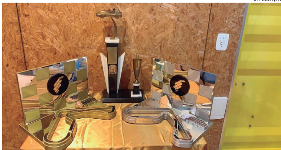
O troféu da 34ª Cascavel de Ouro homenageia o Autódromo Zilmar Beux

Disputada desde 1967, a Cascavel de Ouro se mantém como a segunda corrida mais tradicional do automobilismo brasileiro. Tendo experimentado inúmeros formatos ao longo de 33 edições, a prova destaca vitórias de nomes de prestígio