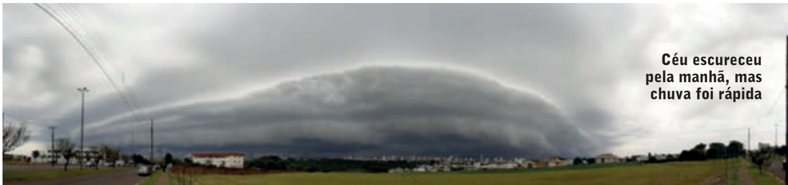
Céu escureceu pela manhã, mas chuva foi rápida

Contudo, estão previstos novos temporais para esta semana. Ao menos até quarta-feira, podem ocorrer chuvas e trovoadas em todo o oeste, mas sem volumes expressivos. Para hoje e quarta a previsão indica a média de 15 milímetros de chuva, mas pode chegar a 20mm em algumas