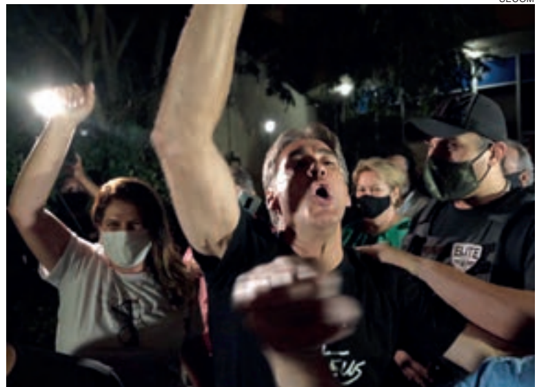
Paranhos vibrou com a vitória: “É uma eleição histórica!”

desconversou sobre futuras mudanças no secretariado. Disse apenas que pretende discutir o assunto até o fim do ano.