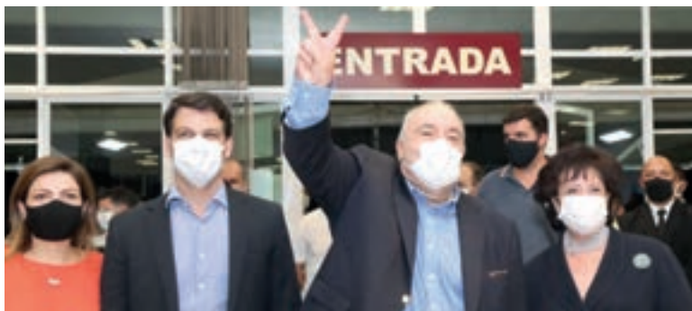
Rafael Greca foi reeleito prefeito de Curitiba: “Foi um ano singular”

Devido à demora na apuração, a maioria das cidades só conheceu os resultados depois da meia-noite. Contudo, em vários locais, os dados parciais já indicavam o segundo turno.