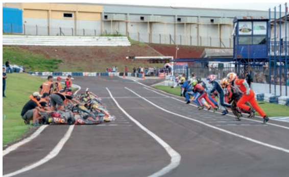
A larga foi ao estilo Le Mans