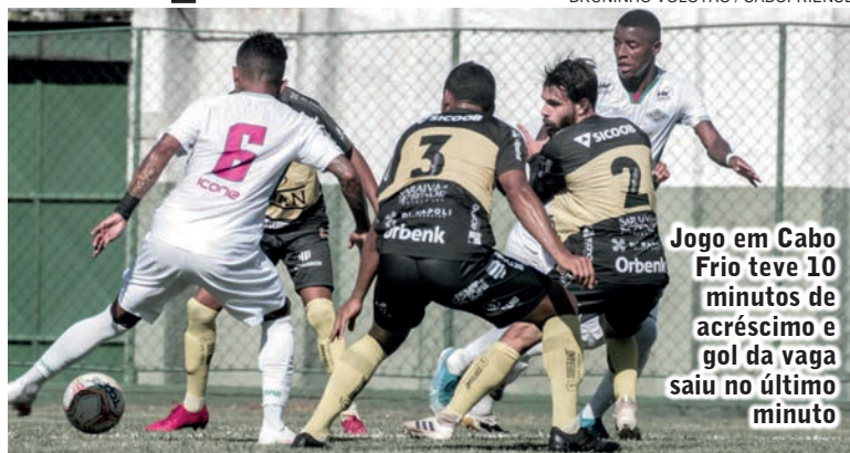
Jogo em Cabo Frio teve 10 minutos de acréscimo e gol da vaga saiu no último minuto

Os jogos de ida serão neste fim de semana, com horário a ser confirmado.