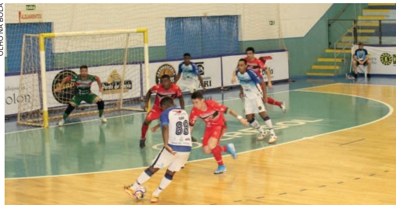
Marechal avançou com vitória na prorrogação