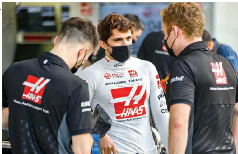
Pietro Fittipaldi estreia na Fórmula 1, categoria que seu avô Emerson é bicampeão

principal porta de entrada para os pilotos chegarem à F1. Pietro dominou a temporada com 6 vitórias, 10 pódios e 10 poles, ganhando a maioria dos pontos para ter sua Superlicença de F1 emitida. O título veio justamente no Circuito Internacional do Bahrein, onde coincidentemente será a estreia de Fittipaldi na F-1.