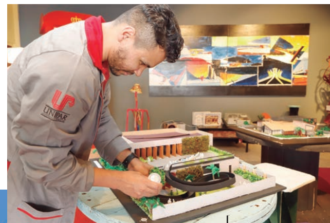
Arquitetura e Urbanismo Unipar