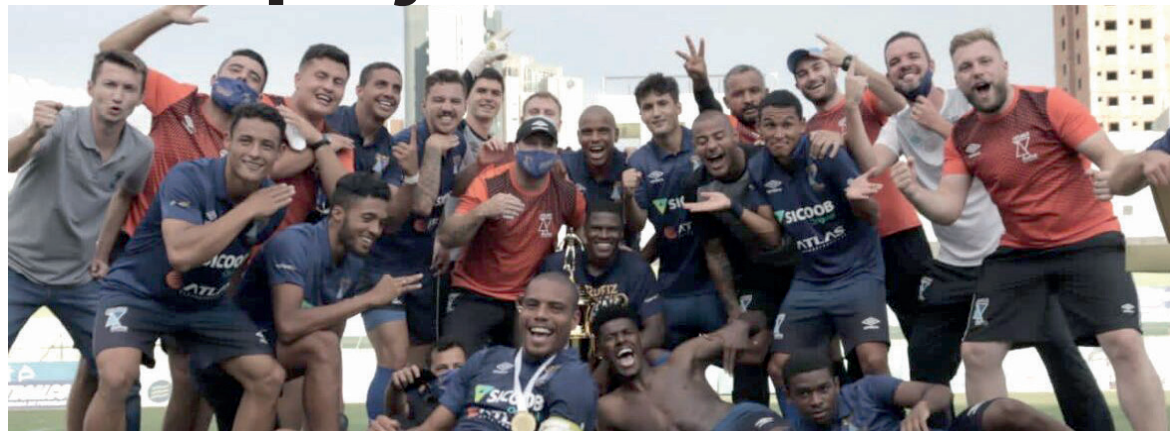
Time chegou à elite em apenas dois anos

Pato Branco - Em apenas dois anos, o projeto de futebol Azuriz já está na primeira divisão do futebol paranaense. O time sagrou-se campeão da Divisão de Acesso com uma vitória por 3 a 0 sobre o Maringá. Criado em Marmeleiro e, atualmente, radicado em Pato Branco, o time vai se