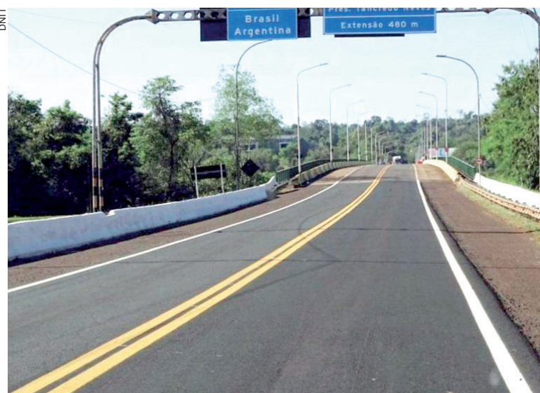
A ponte que liga o Brasil à Argentina está fechada desde a metade de março

A carga, avaliada em cerca de R$ 21,25 milhões, foi transportada em sete carretas - cinco partiram de Mundo Novo (MS), com 77 toneladas, e outras três saíram de Guaíra (PR), com