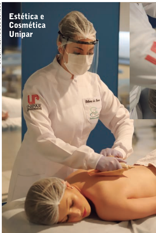
Estética e Cosmética Unipar