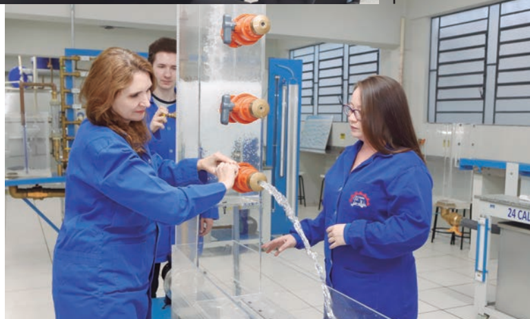
Engenharia Civil Unipar