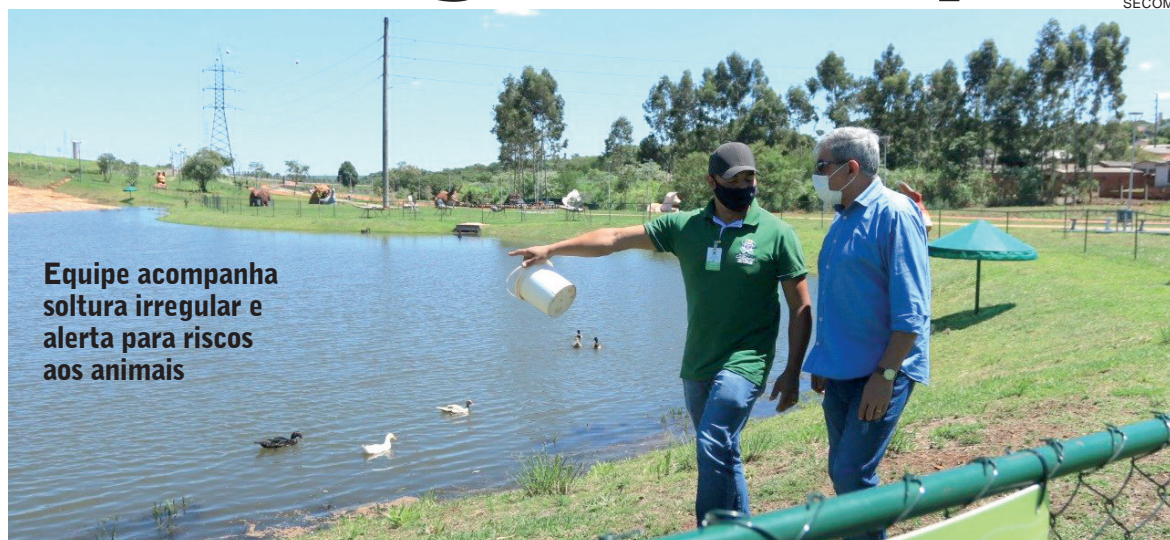
Equipe acompanha soltura irregular e alerta para riscos aos animais

As aves aquáticas existentes no lago do Ecopark Oeste são alimentadas todos os dias por uma equipe de servidores do zoológico, com ração balanceada e milho. Além disso, há