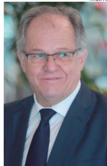
Presidente da FPF, Hélio Cury deve comandar a reunião

Com a rescisão de contrato com a Dazn, a expectativa é de que surja um novo canal disposto a transmitir os jogos e repassar recursos para as equipes. Oficialmente, não há confirmação, mas se especula que a RPC pode retomar as transmissões em TV aberta e um canal de streaming também seja efetivado. Se isso ocorrer,