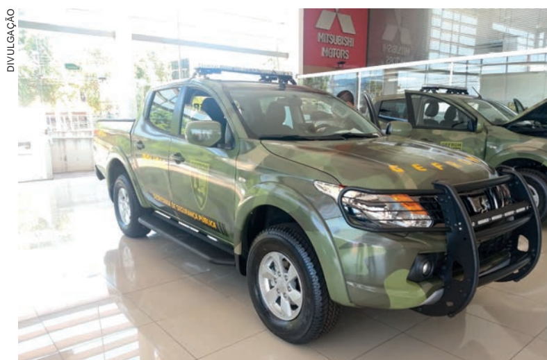
Veículos vão reforçar as ações nas fronteiras e nas divisas do Estado

468 milhões aos criminosos. O Estado também recebeu a primeira base integrada - com atuação no Mato Grosso do Sul e no Paraná - equipada com sistema de comunicação, que auxilia no intercâmbio de informação entre os agentes que trabalham em operações de combate a ilícitos na região. Além disso, já estão contratadas as aquisições de kits de Atendimento Pré-Hospitalar tático, óculos de visão noturna, capacetes e coletes de proteção balística.