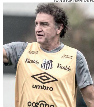
O paranaense Cuca pode chegar a mais uma final de Libertadores