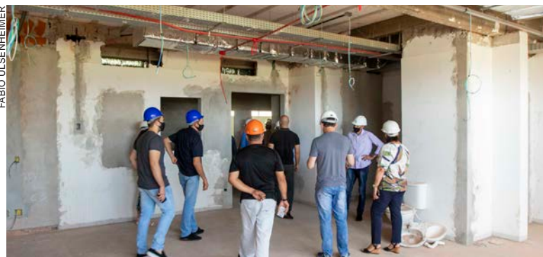
A intenção é somar esforços para colocar hospital em funcionamento