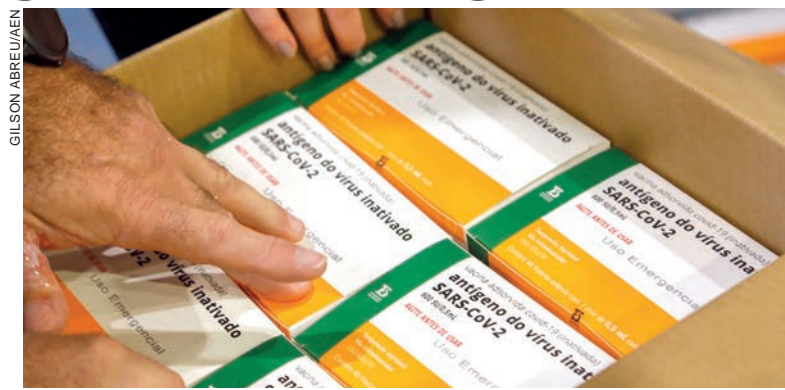
Região recebe cerca de 18 mil doses da vacina

Beto Preto frisou que a vacina não pode ser utilizada