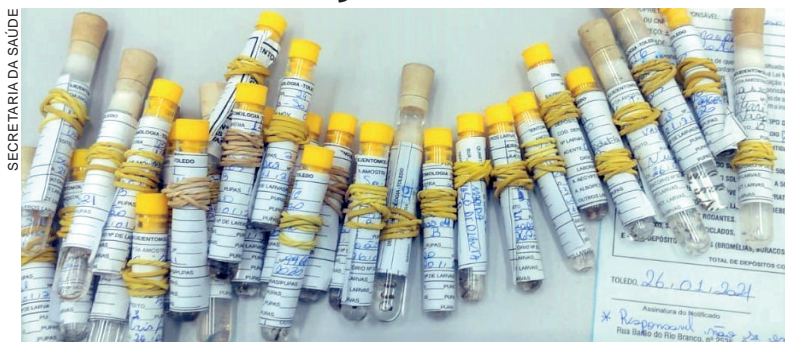
SECRETARIA DA SAÚDE Foram encontrados 52 criadouros de mosquito em dois cemitérios