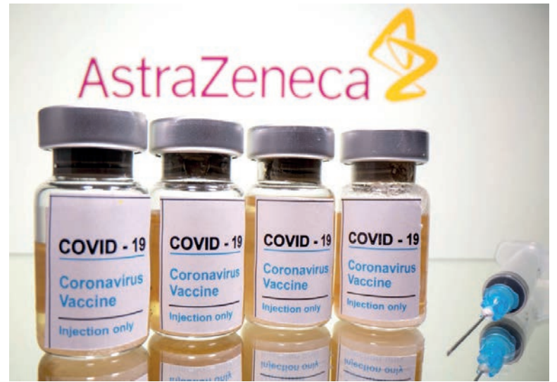
Brasil recebeu, até agora, apenas 2 milhões de doses da AstraZeneca que vieram da Índia

A vacina Oxford/AstraZeneca é a única para a qual o governo federal já tem contrato de aquisição. Como a Fiocruz ainda não recebeu os primeiros lotes de ingrediente farmacêutico ativo (IFA) para iniciar a produção de ampolas com o produto no País, a aplicação desse imunizante começou esta semana com as 2 milhões de doses que chegaram prontas da Índia. Mais