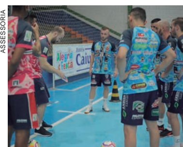
Novos contratados do Cascavel Futsal já estão treinando