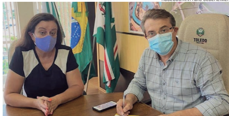
Toledo retoma projetos de auxílio e manutenção dos atletas

“Quando assumi pela primeira vez a Secretaria de Esportes e Lazer de Toledo, em 2013, já conhecia profundamente a realidade dos nossos profissionais de Educação Física. Nossos atletas chegavam aos 18 anos, iam embora para outros centros ou paravam de treinar para poder trabalhar. O programa trouxe a oportunidade para que os nossos jovens permaneçam em Toledo, curseem o