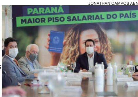
JONATHAN CAMPOS AEN

O governador Ratinho Junior ratificou nessa terça-feira (9) os novos valores do salário mínimo regional do Paraná, que se mantém como o maior do País. Dividido em quatro faixas salariais, que variam de R$ 1.467,40 a R$ 1.696,20, conforme a categoria, o reajuste foi aprovado pelo Ceter (Conselho Estadual do Trabalho, Emprego e Renda). O piso será aplicado já na folha de fevereiro, com valores retroativos a janeiro, e é válido até 31 de dezembro de 2021. “A valorização do piso vem em um momento importante para o Paraná na geração de empregos. Este é um dos compromissos que temos com o Estado, de atrair mais empresas e criar mais vagas para a população”, destacou o governador.