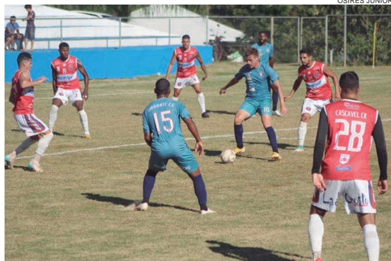
Quarta-feira será de jogos-treinos para os times de Cascavel

“Estamos trabalhando com a ideia de montar um time coeso na defesa e que tenha boas condições de