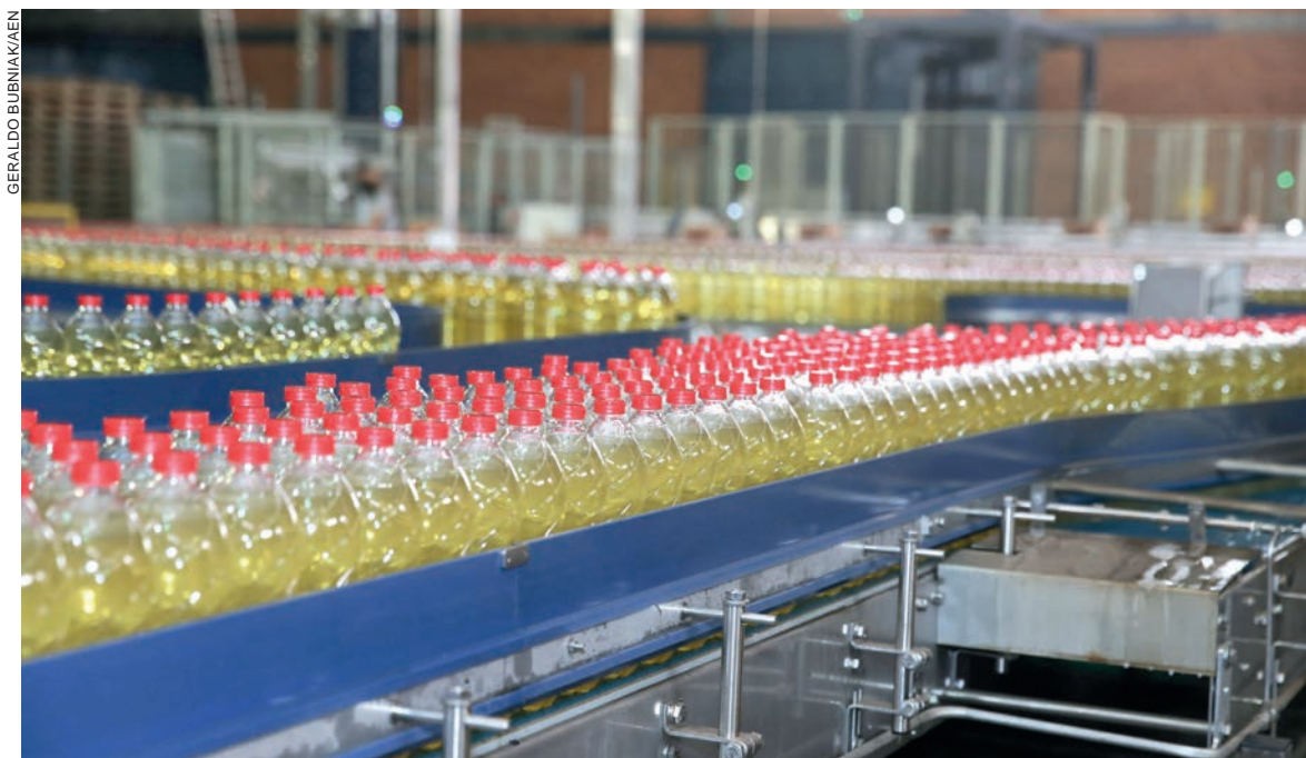
Indústria de produtos alimentícios teve um dos maiores aumentos

Os seguidos índices positivos, porém, não foram suficientes para fechar 2020 com crescimento em relação a