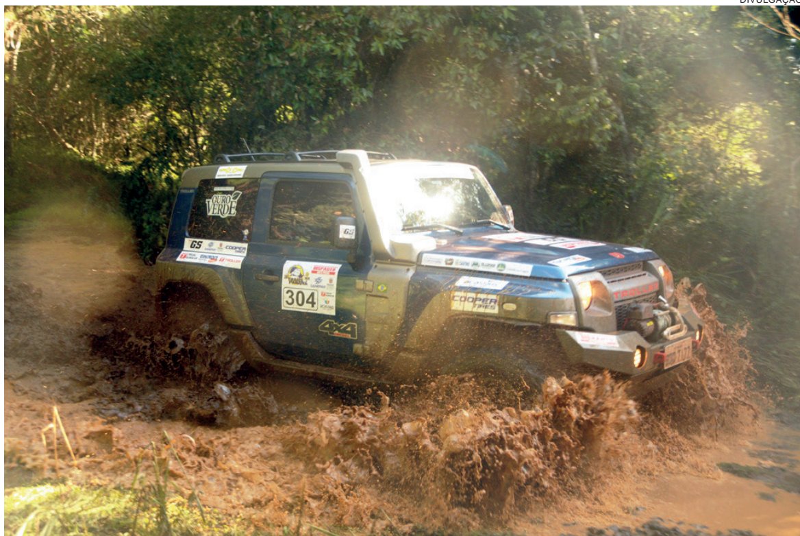
A 27ª edição do Transparaná começa no próximo dia 16, com largada em Foz do Iguaçu

Em 2021, o Transparaná conta com o importante incentivo do governo do Estado do Paraná, o que é bastante relevante, uma vez que evidencia e traz peso à marca. “É uma alegria para o governo do Estado participar dessa história. É um evento que oferece a oportunidade de conhecer o interior do nosso belo estado, fomentando o esporte e o turismo, que são dois importantes motores no desenvolvimento econômico e da qualidade de vida da população”, salientou o