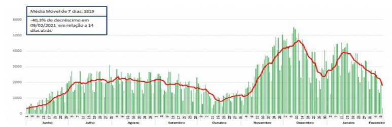
Fonte: Dados de casos confirmados de residentes no Paraná consultados da planilha de monitoramento diário de casos do CVIE/DAV/SESA no dia 10/02/2021, às 12h. Dados preliminares, sujeitos a alterações.