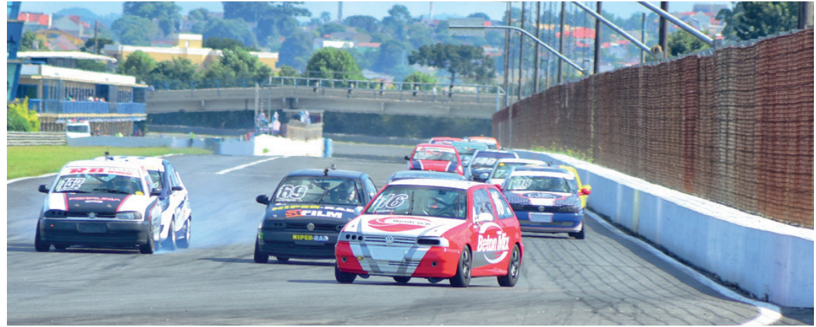
A temporada 2021 do Paranaense de Velocidade terá a primeira etapa em Curitiba